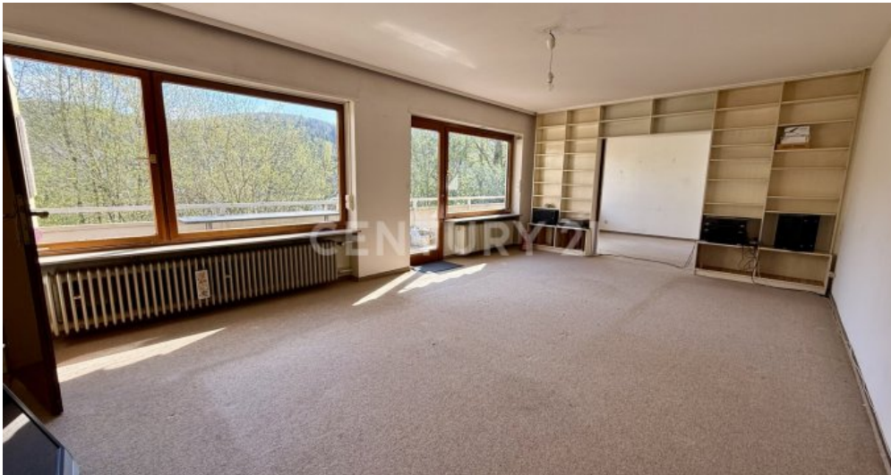
großes lichtdurchflutetes Wohnzimmer EG