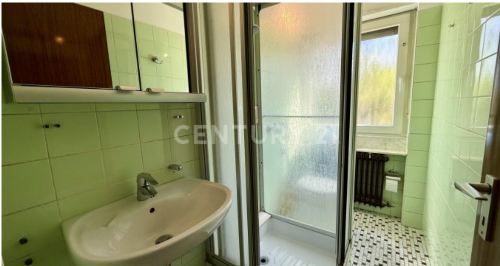
Badezimmer mit Dusche UG