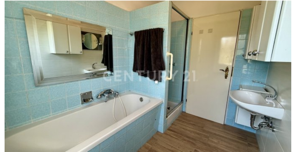
mit Wanne und Dusche