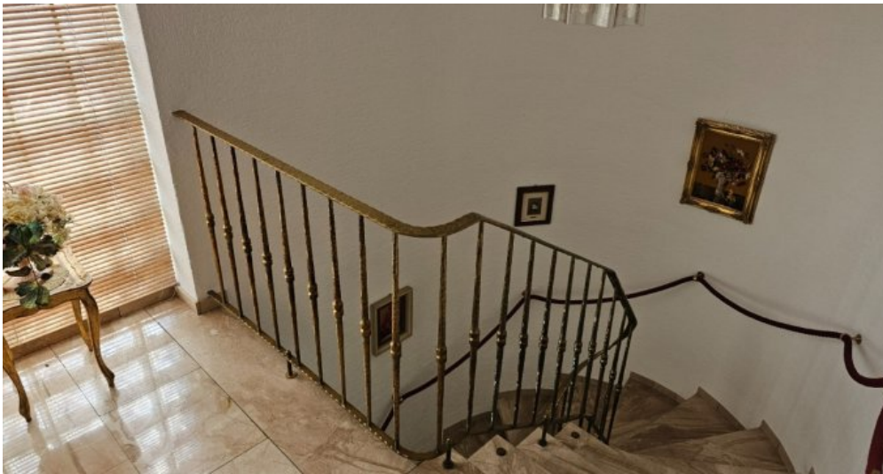
Treppe zum UG