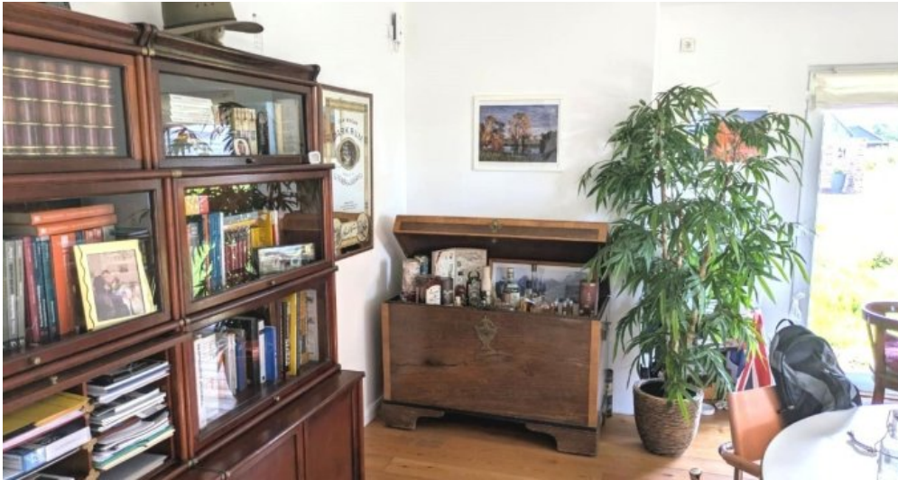
Büro in der Halle