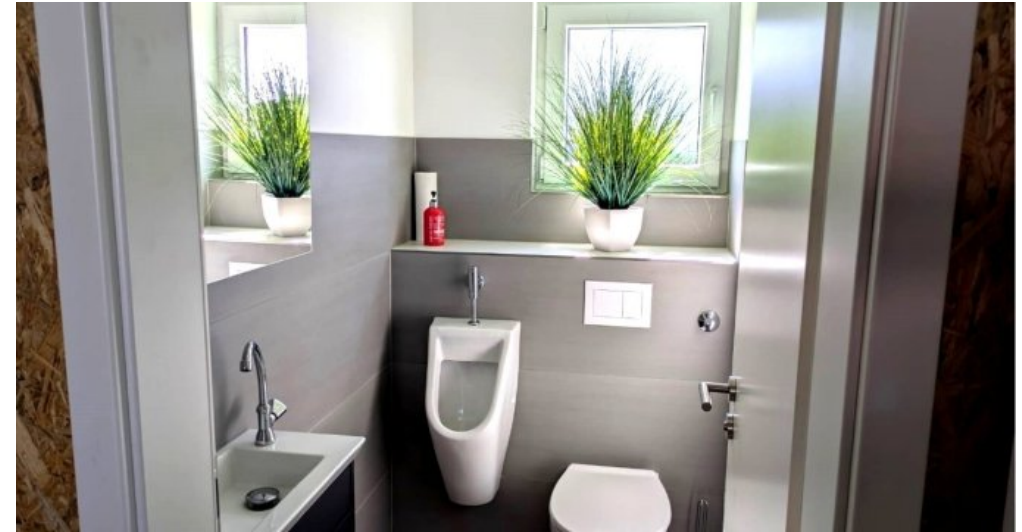
Gäste WC in der Halle