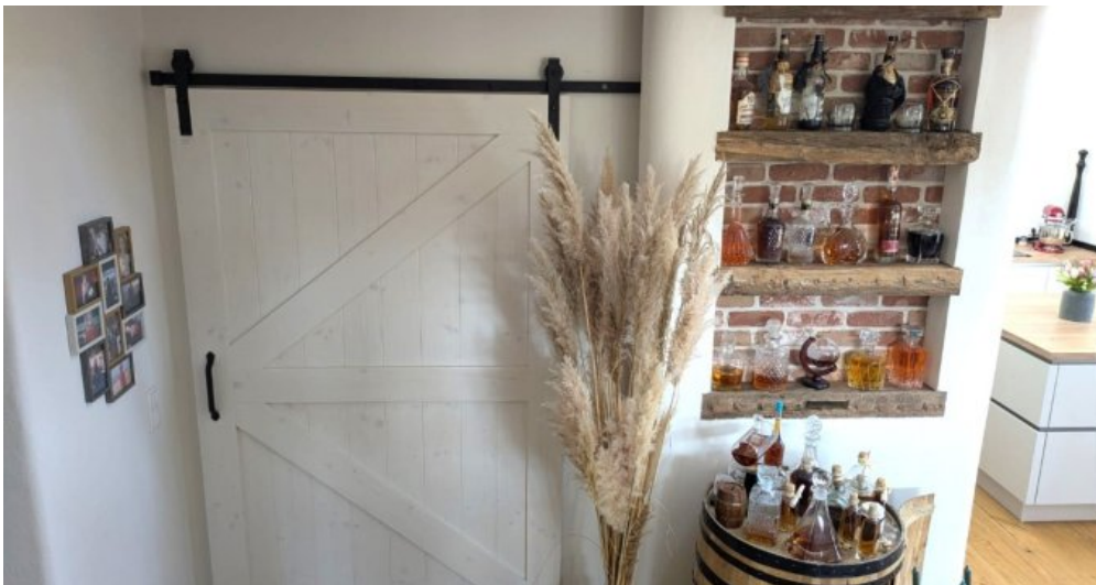
Holzschiebetür zum Windfang