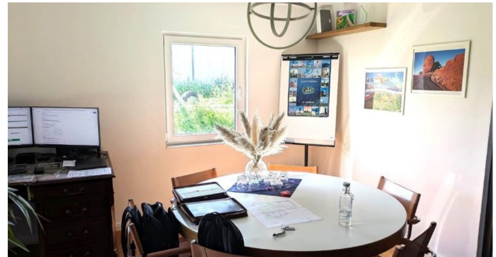
Büro in der Halle