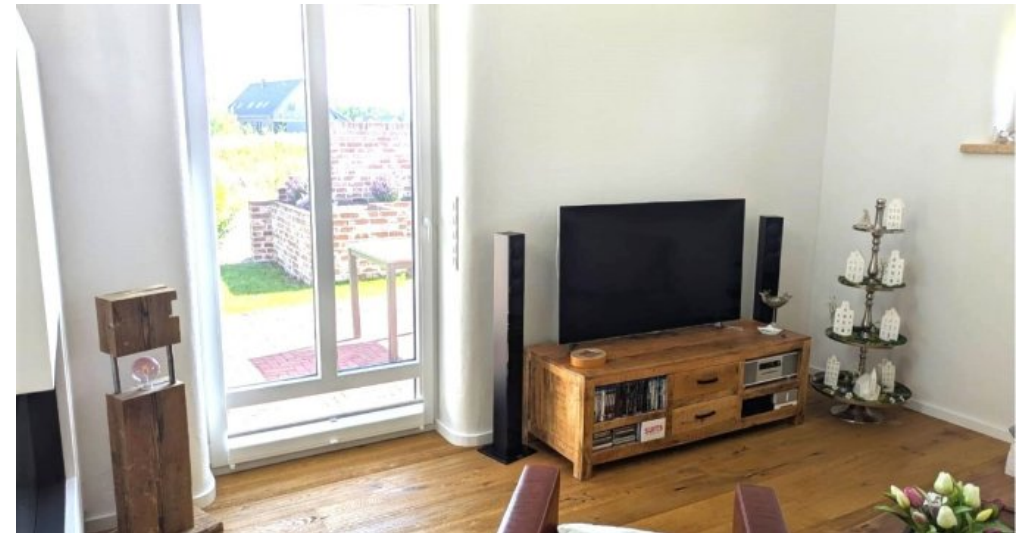
Wohnbereich mit Ausgang zur Terrasse