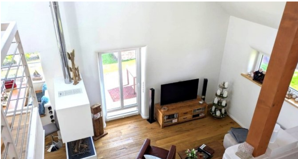
Blick von der Galerie in den Wohnbereich