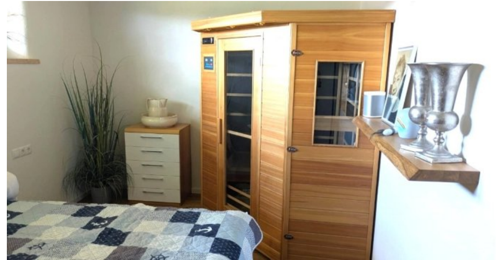
Schlafzimmer mit Wärmekabine