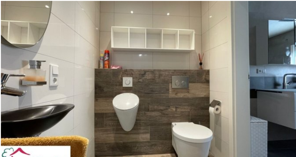
Badezimmer mit separatem WC