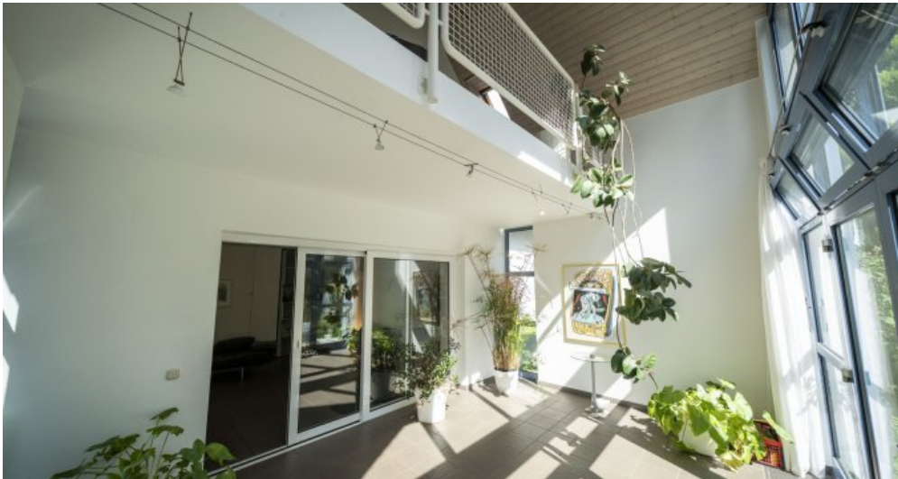
Wintergarten mit Empore 1. Obergeschoss (RH)