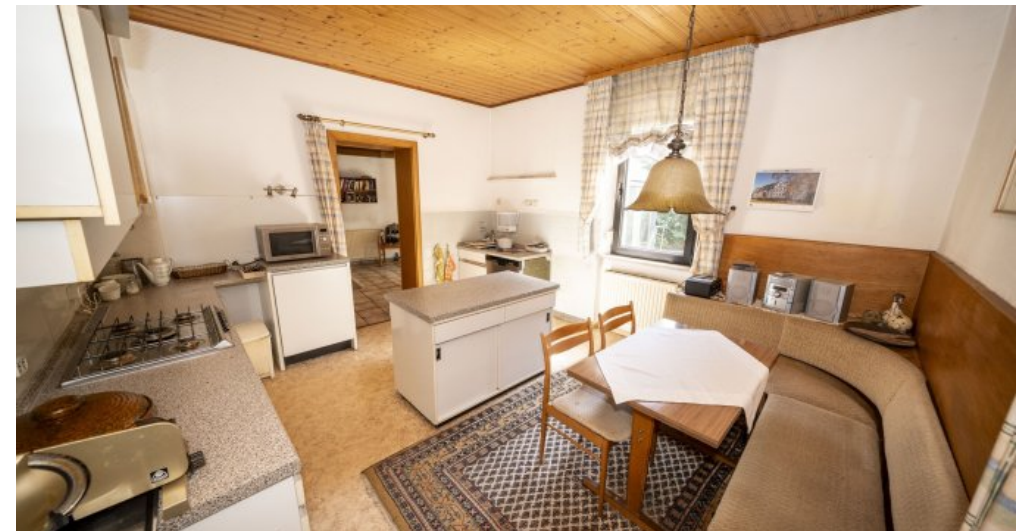
Küche Erdgeschoss (LH)