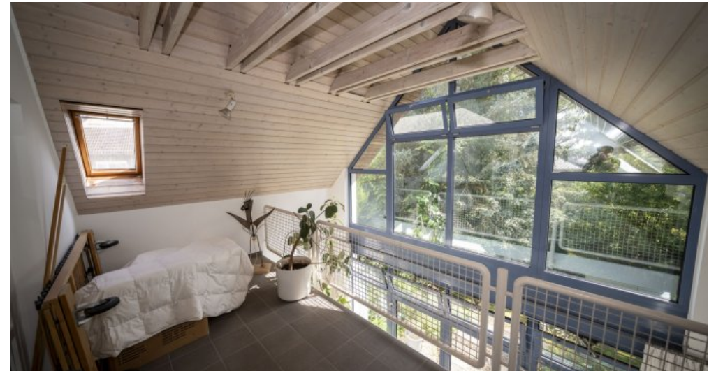
Empore Dachgeschoss (RH)