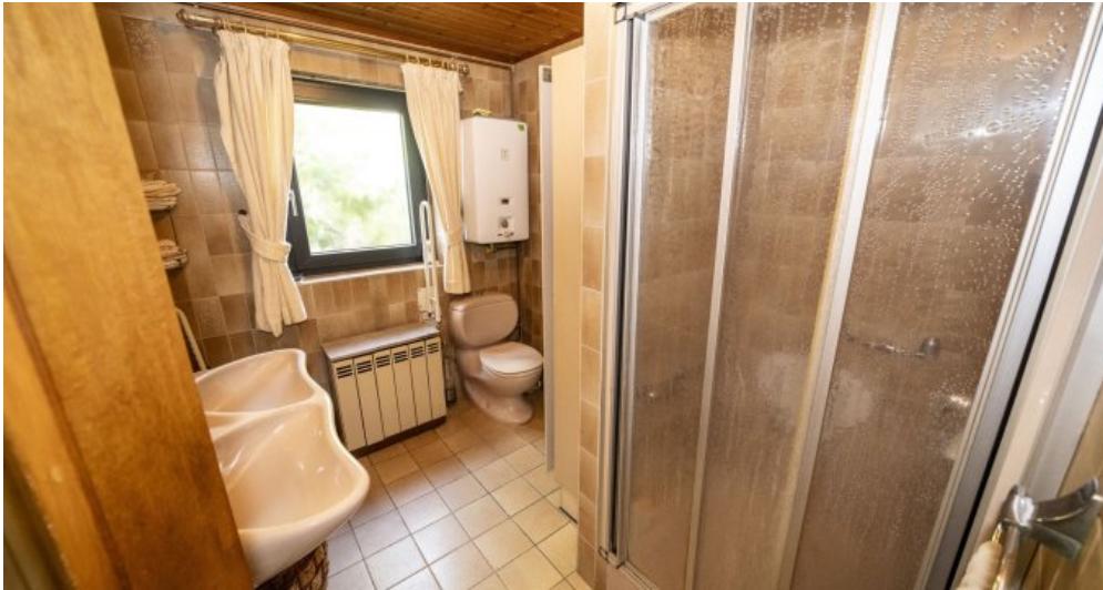
Badezimmer Erdgeschoss (LH)