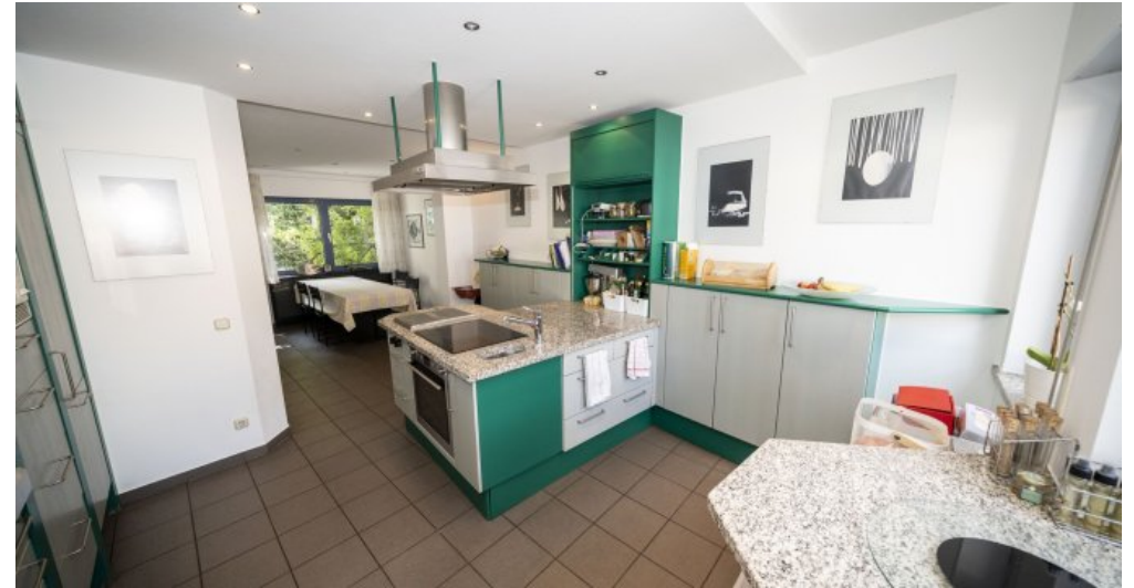
Küche 1. Obergeschoss (RH)