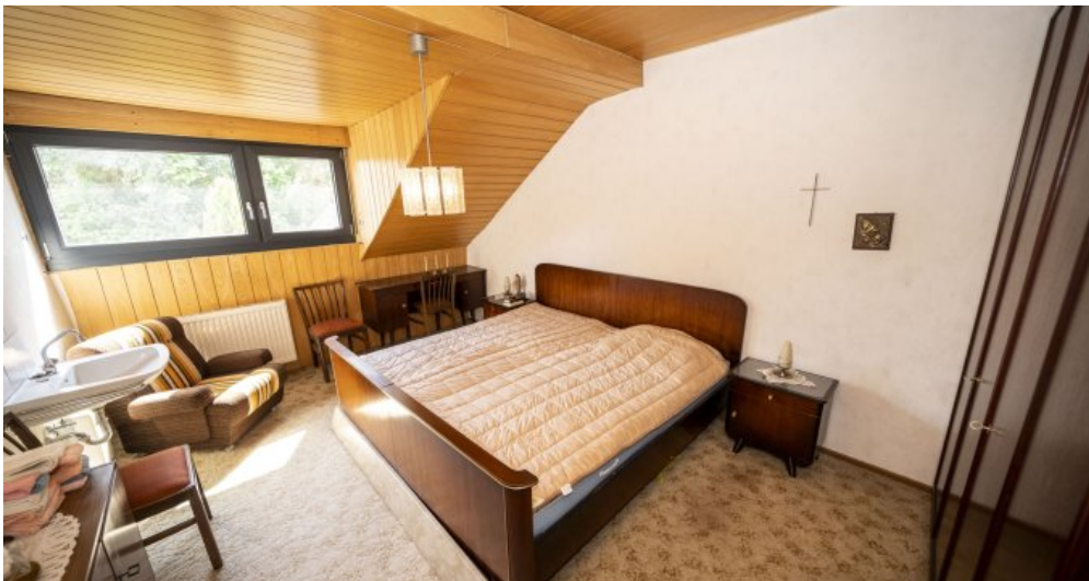
Zimmer 3 Dachgeschoss (LH)