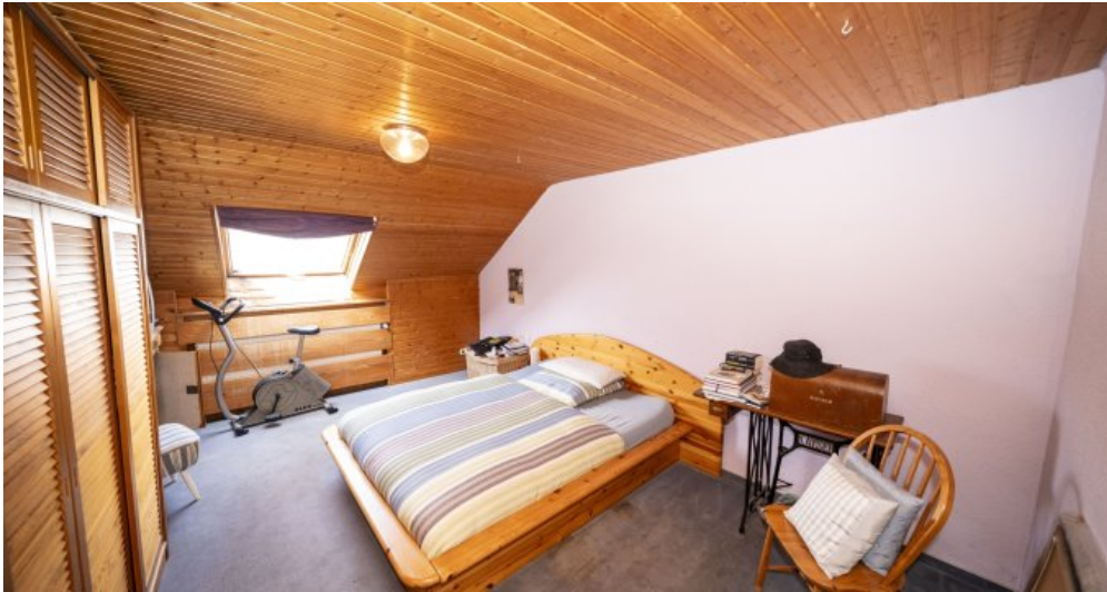
Zimmer 1 Dachgeschoss (RH)