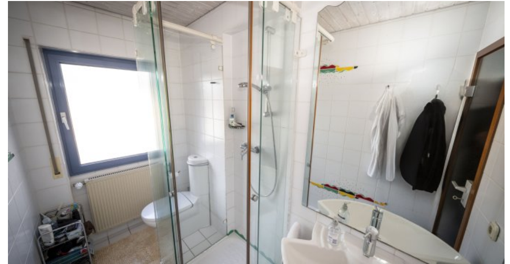
Badezimmer Dachgeschoss (RH)