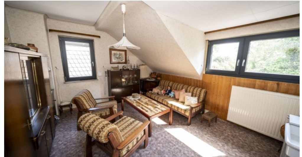
Zimmer 2 Dachgeschoss (LH)