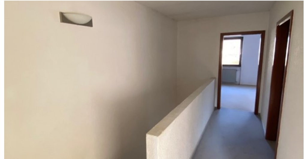
Blick zur Galerie