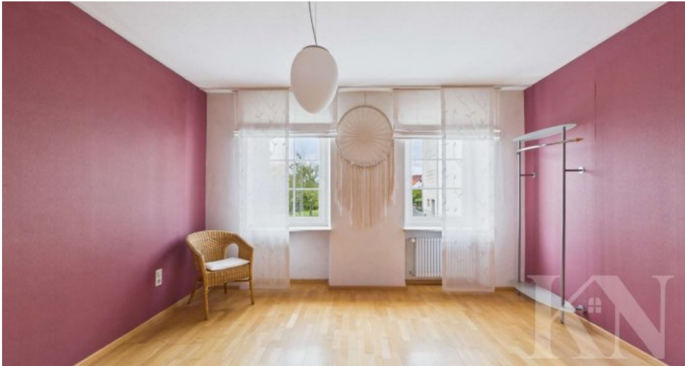
Schlafzimmer / Büro EG