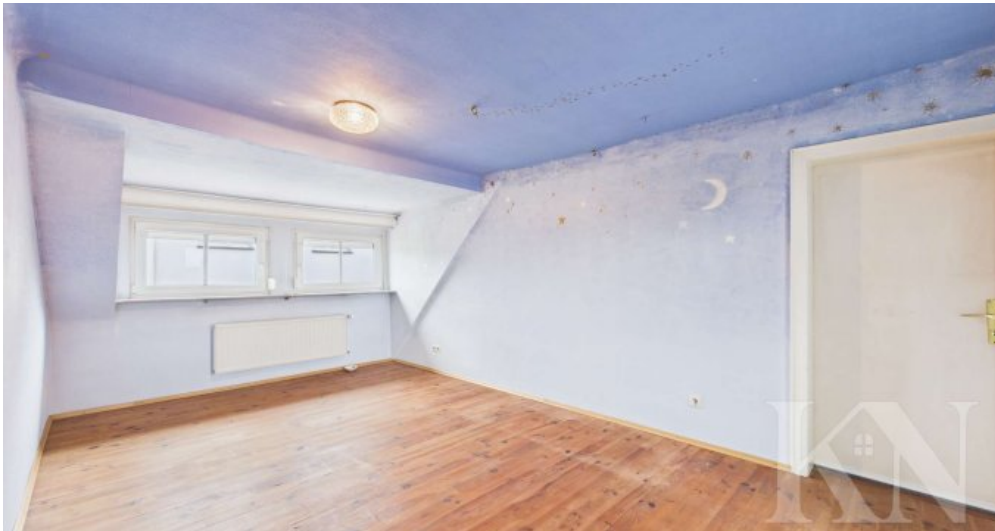
Zimmer 1 OG