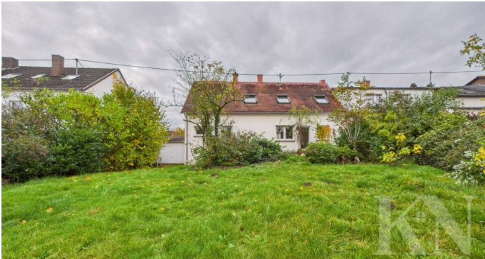
Garten / Rückansicht