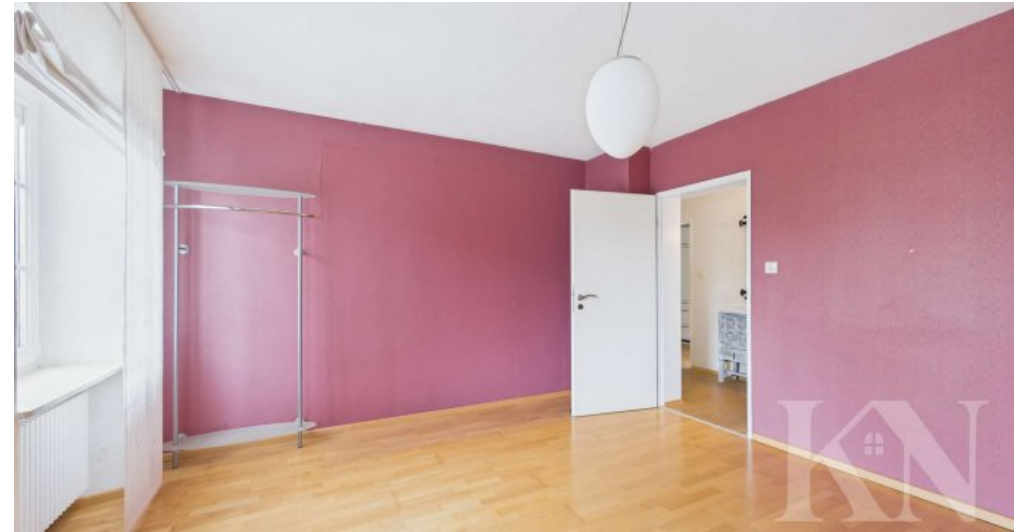
Schlafzimmer / Büro EG