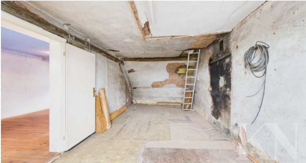
Zimmer 2 OG