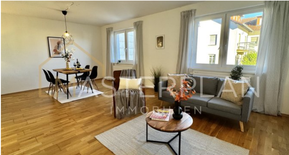
Wohn-und Esszimmer 1.OG