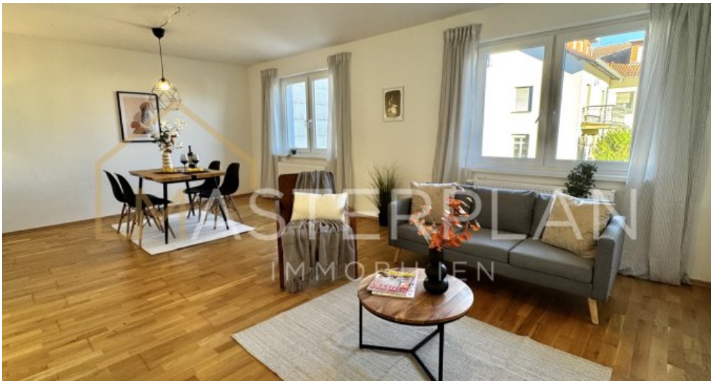
Wohn-und Esszimmer 1.OG