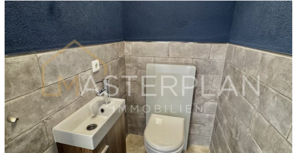
Gäste - WC 1.OG