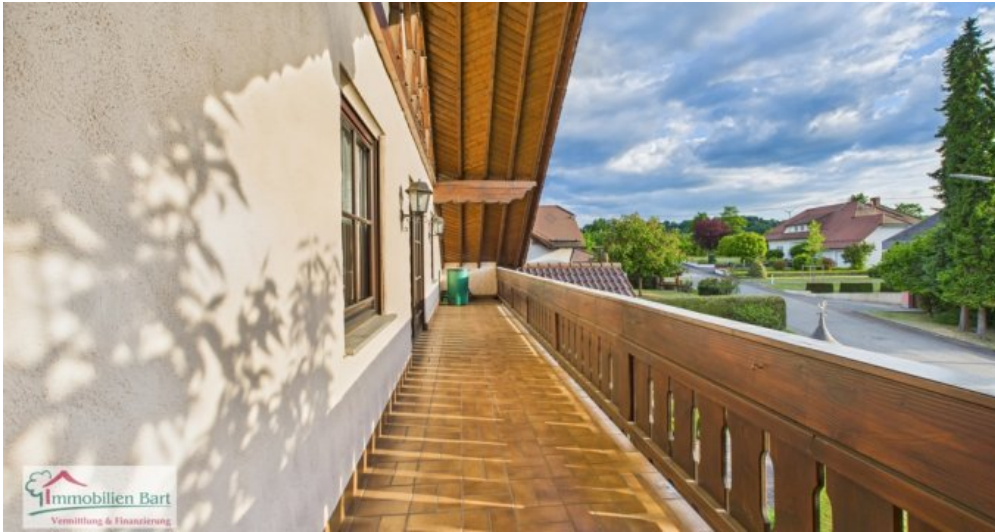
überdachter Balkon Westseite