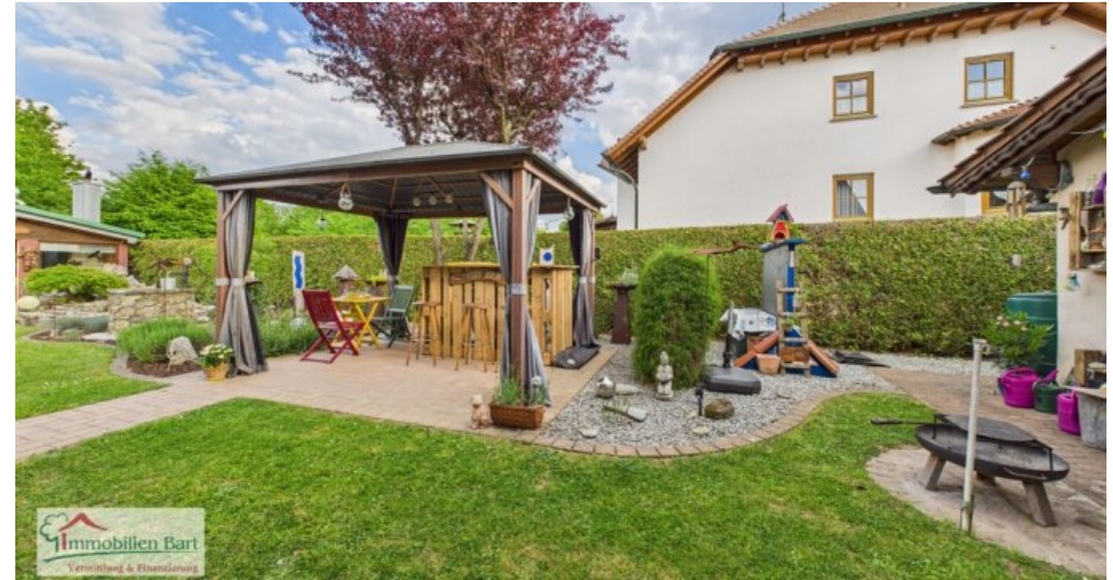
Garten mit Pavillion