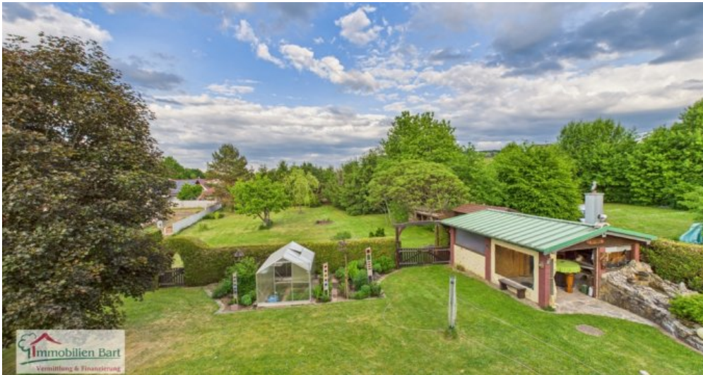
Gartenansicht Richtung Osten