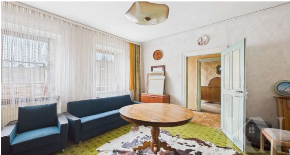
OG Schlafzimmer 2