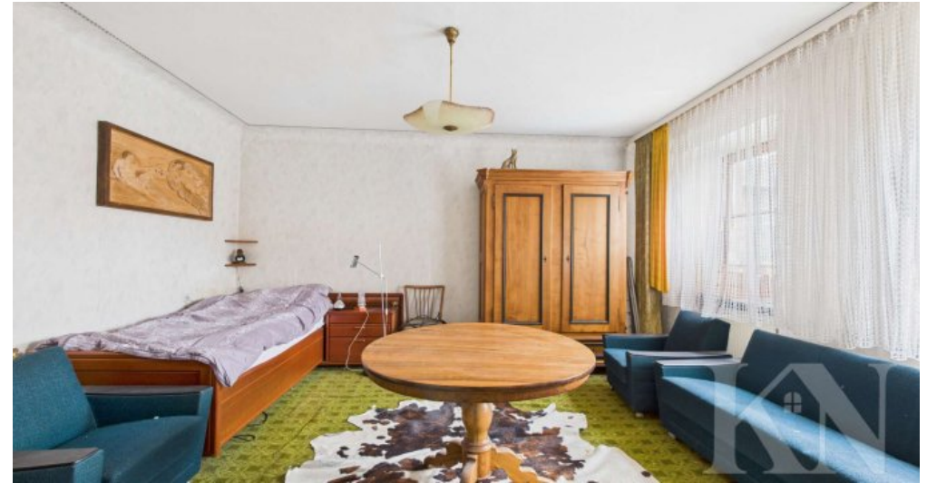
OG Schlafzimmer 2