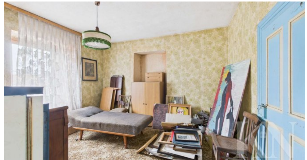
OG Schlafzimmer 3