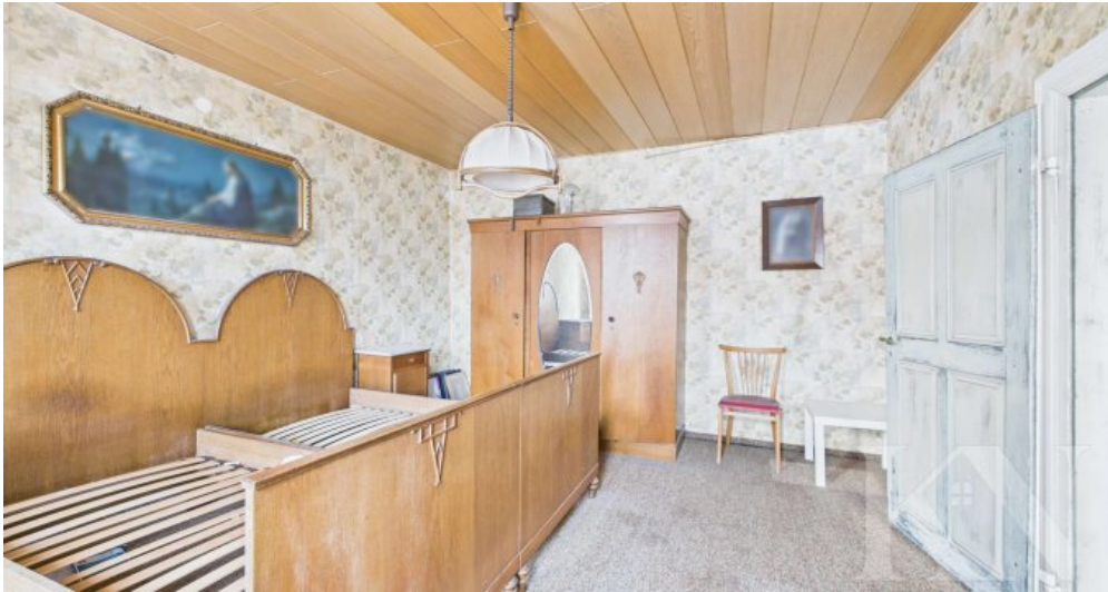
OG Schlafzimmer 1