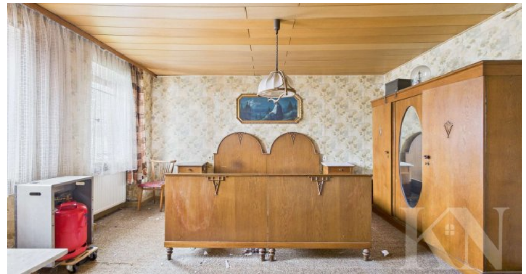
OG Schlafzimmer 1