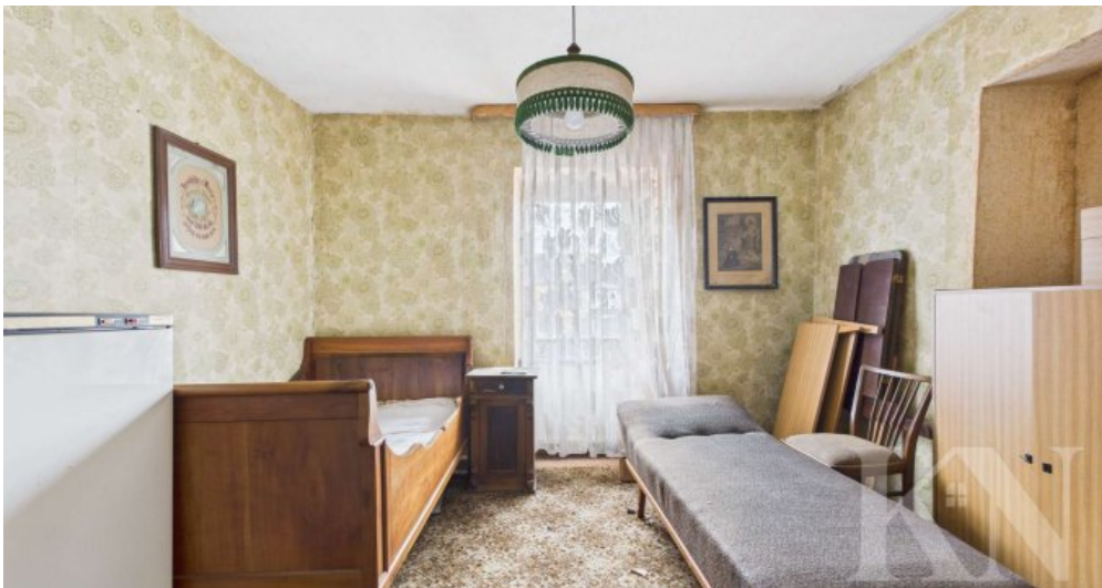
OG Schlafzimmer 3