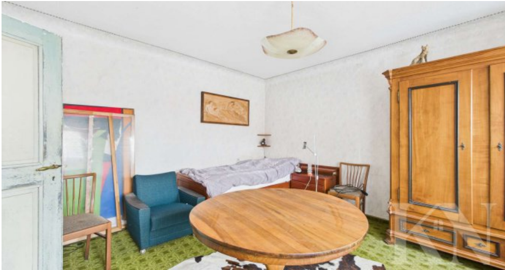
OG Schlafzimmer 2