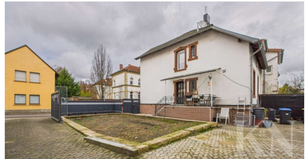
Seitenansicht / Hof