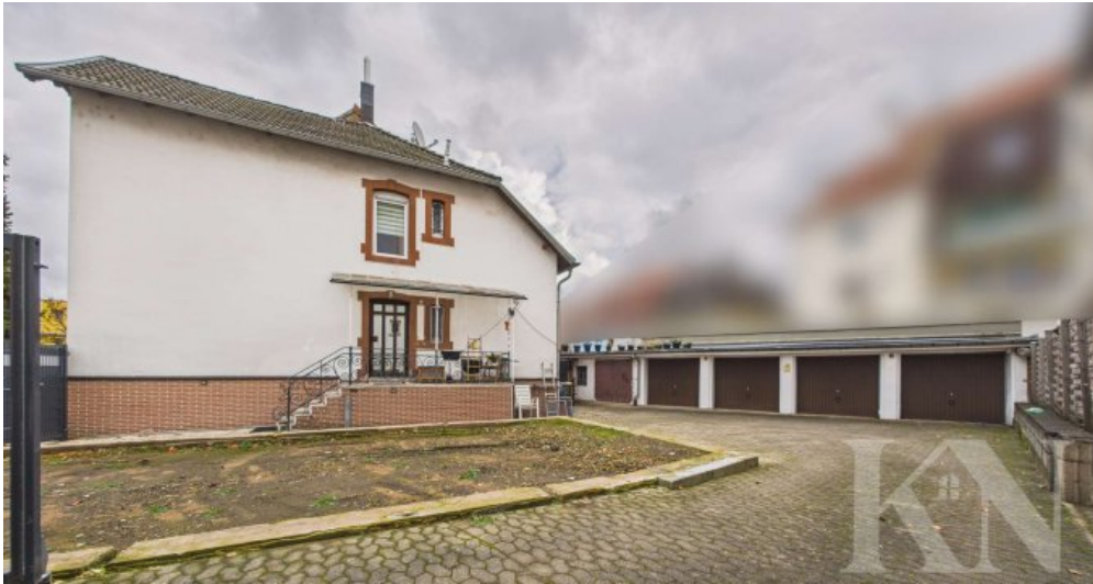
Seitenansicht / Hof + Garagen