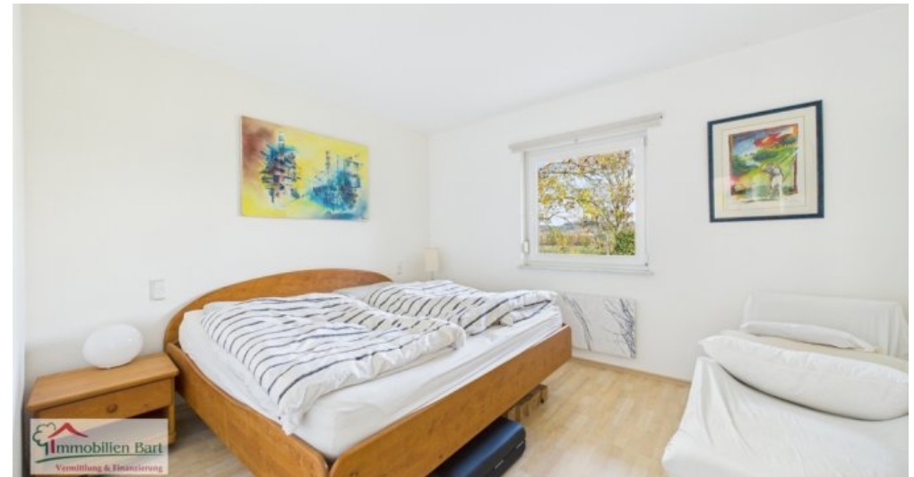
Schlafzimmer mit Ankleideraum