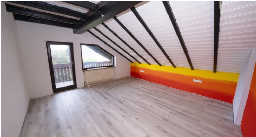
Zimmer 1 DG