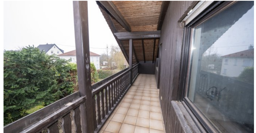
Balkon 1 DG