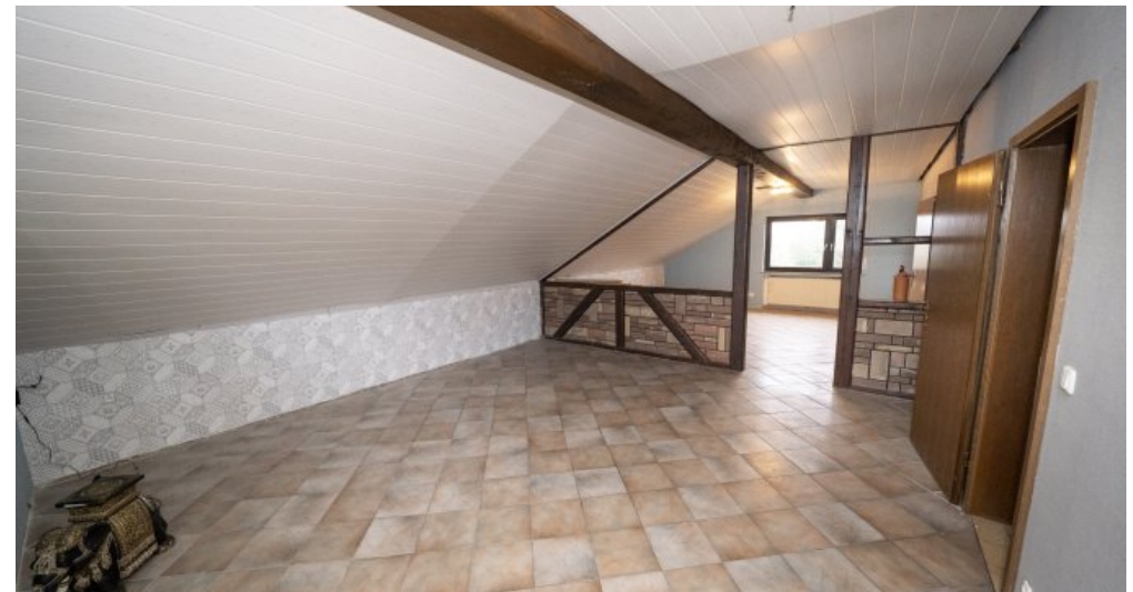
Wohn- Esszimmer DG