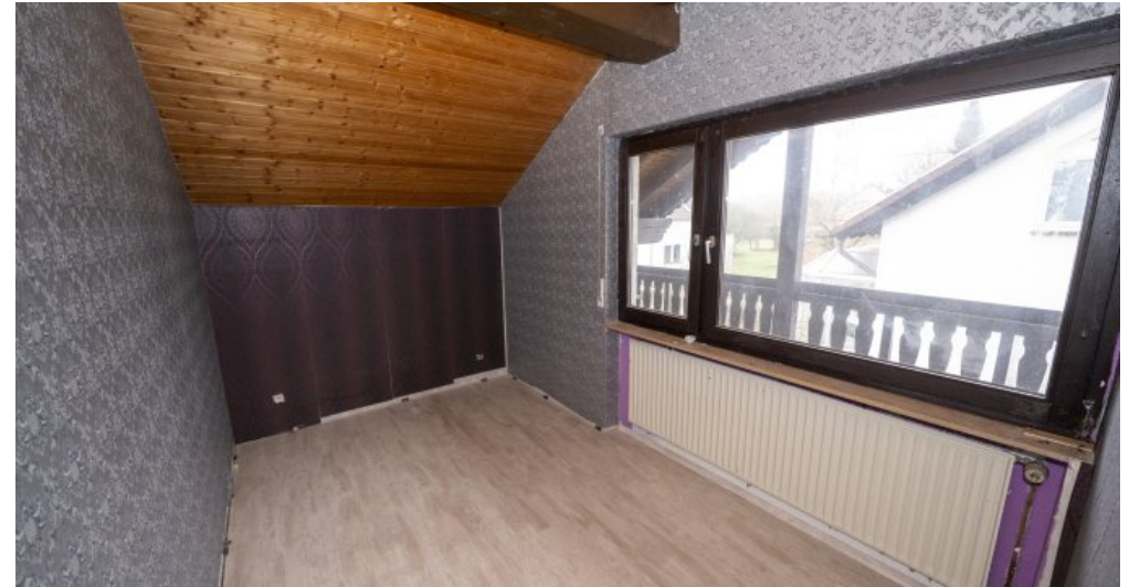
Zimmer 2 DG