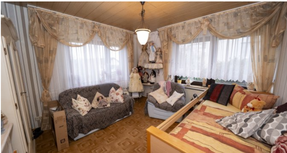
Schlafzimmer 2 EG