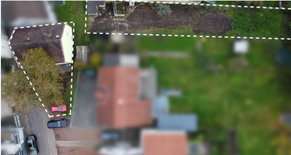
Haus + Grundstück