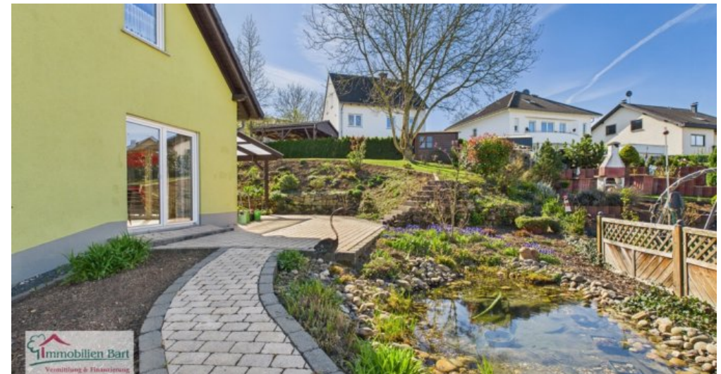
Terrasse mit Gartenteich