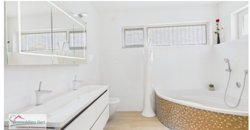
Bad zugehörig zum Hauptschlafzimmer