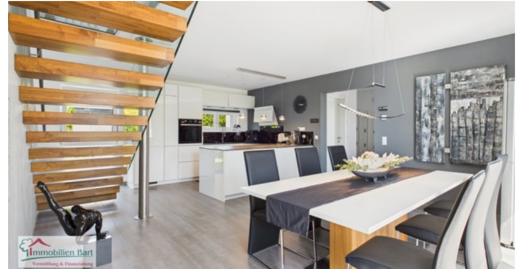
Essbereich mit offener Küche