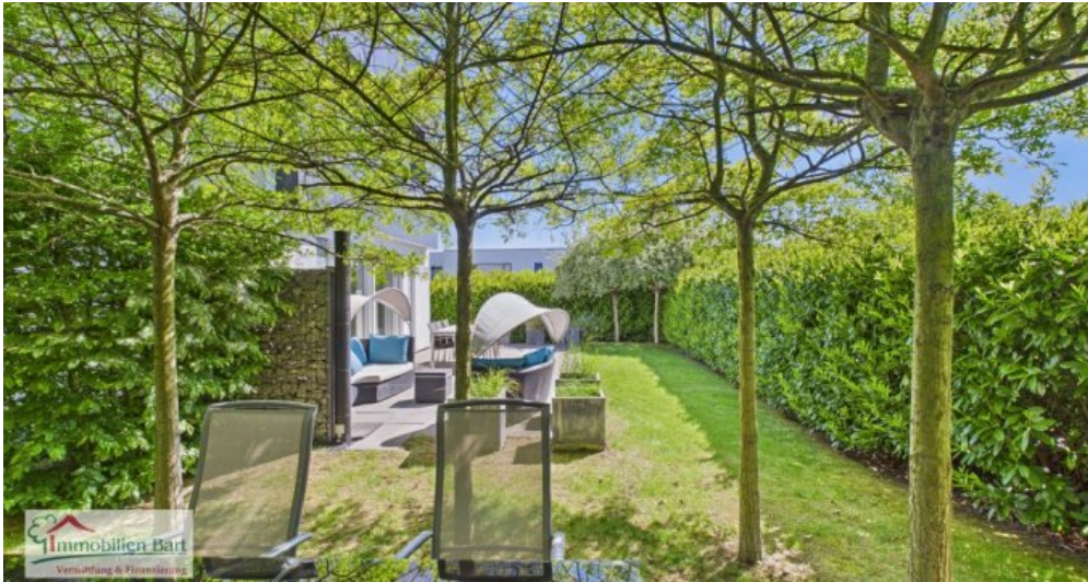
Sitzbereich im Garten