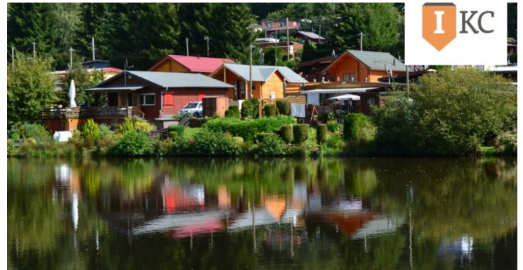
Bild 1 SchwarZRindersee