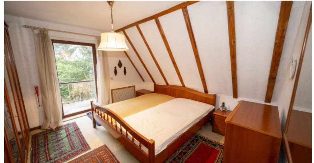
Schlafzimmer 1 Dachgeschoss