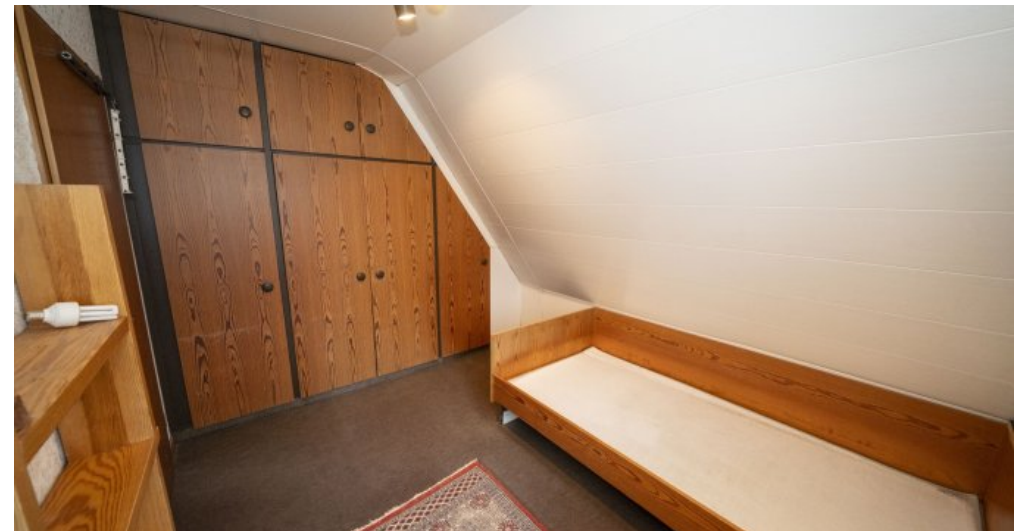
Schlafzimmer 3 Dachgeschoss