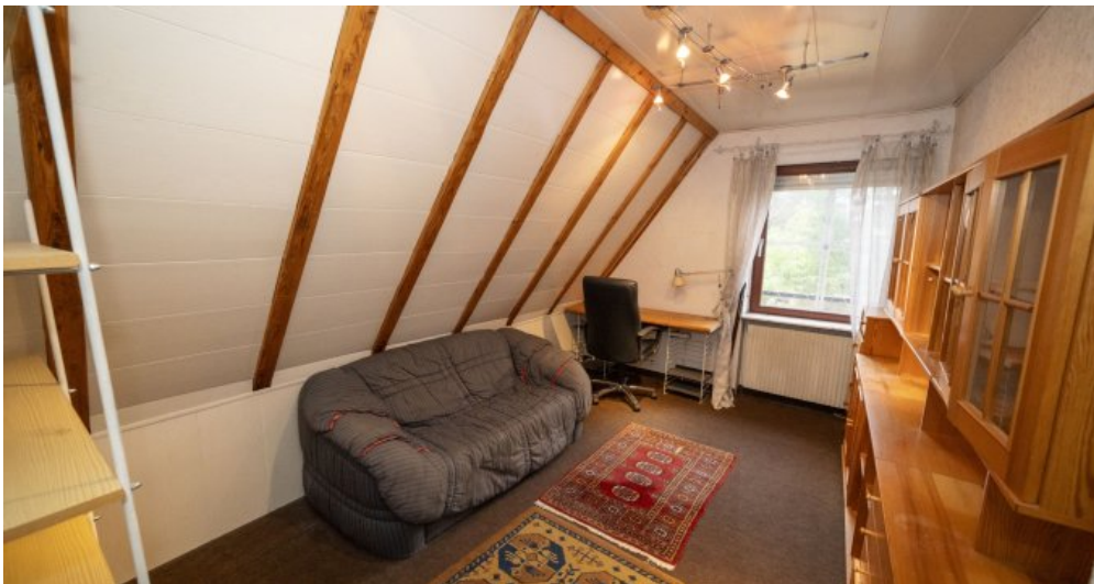
Schlafzimmer 2 Dachgeschoss