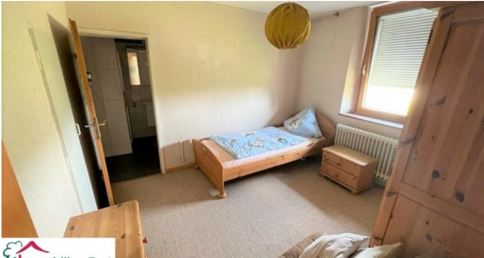
Schlafzimmer OG mit Zugang zum Bad