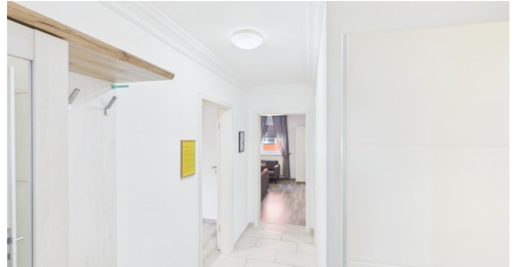
Flur 2 Etage