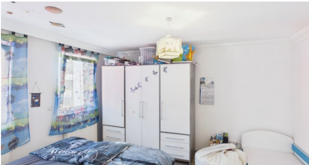
Schlafzimmer 1 Etage