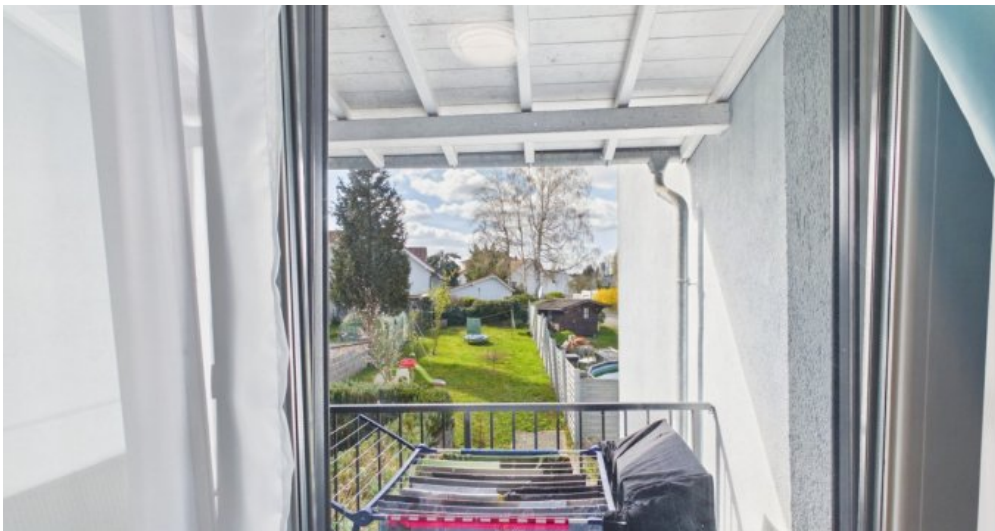
Balkon 1 Etage