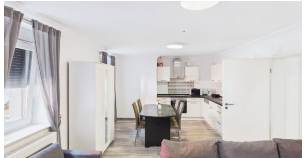
Esszimmer/Küche 2 Etage