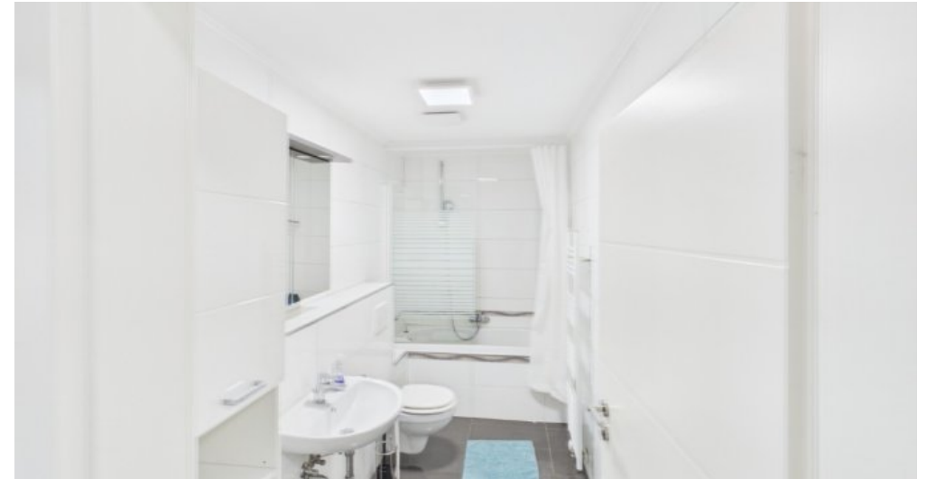
Bad 2 Etage