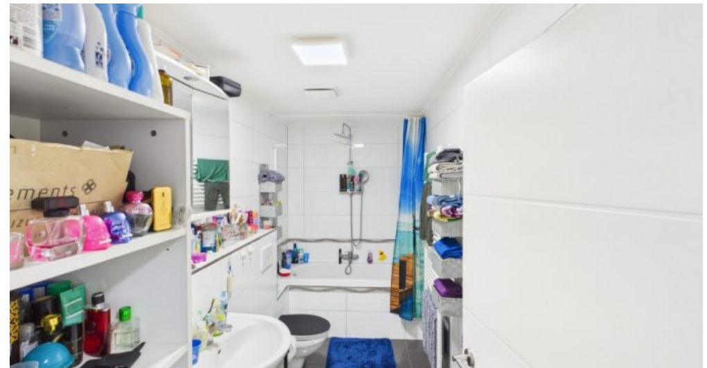
Bad 1 Etage