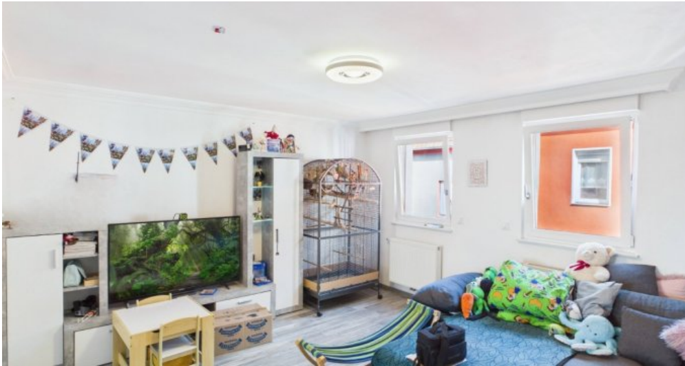
Wohnzimmer 1 Etage