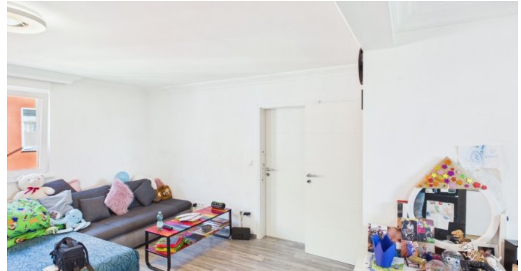
Wohnzimmer 1 Etage