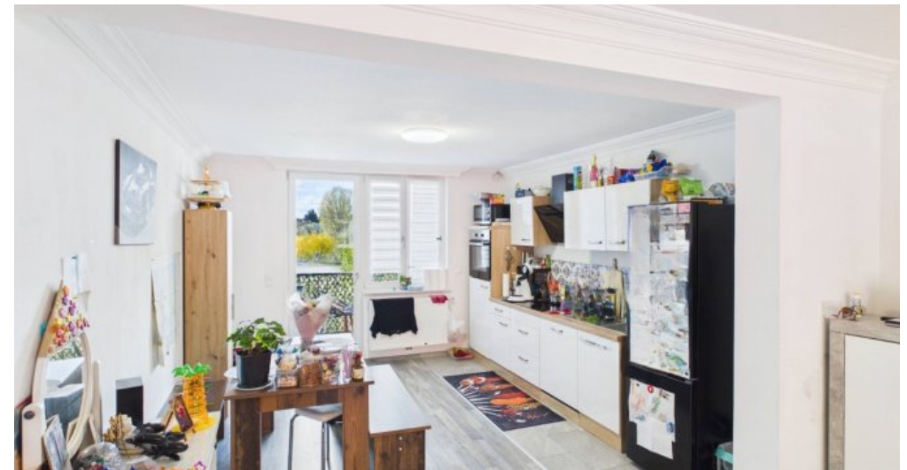
Küche 1 Etage