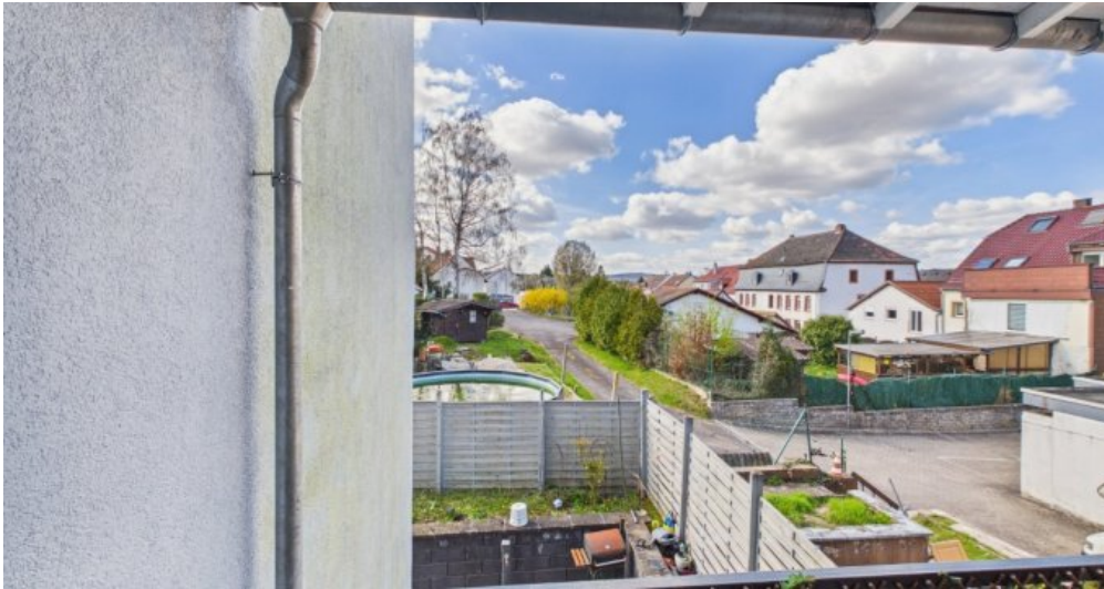
Balkon 2, 1 Etage