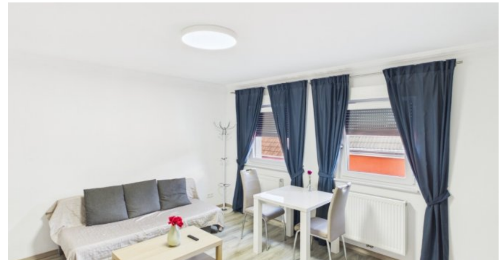
Wohnzimmer 2 Etage