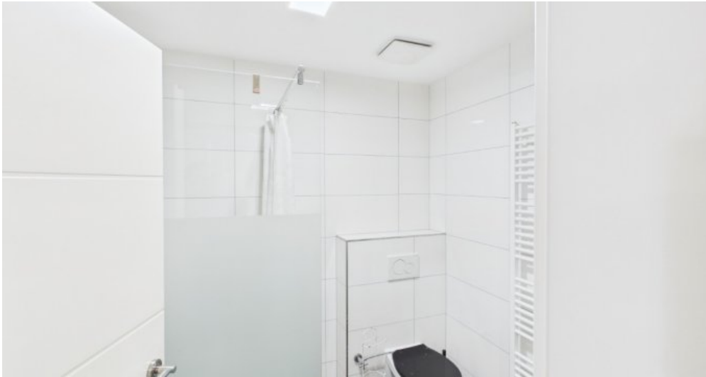
Bad 2 Etage