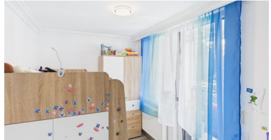
Kinderzimmer 1 Etage