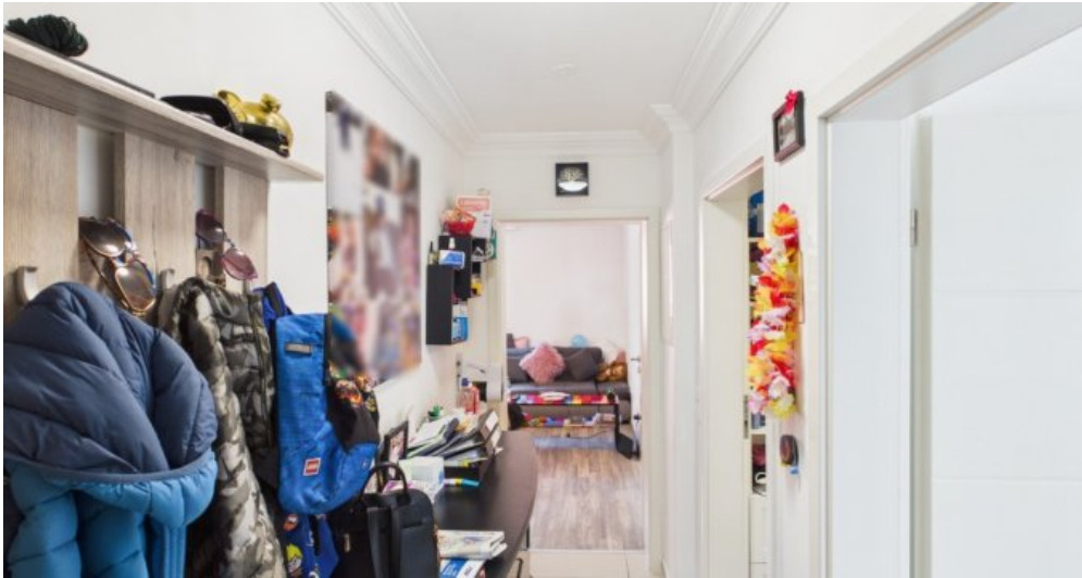
Flur 1 Etage