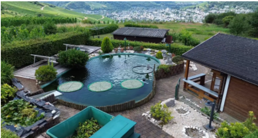
Gartenhaus inkl. Teich