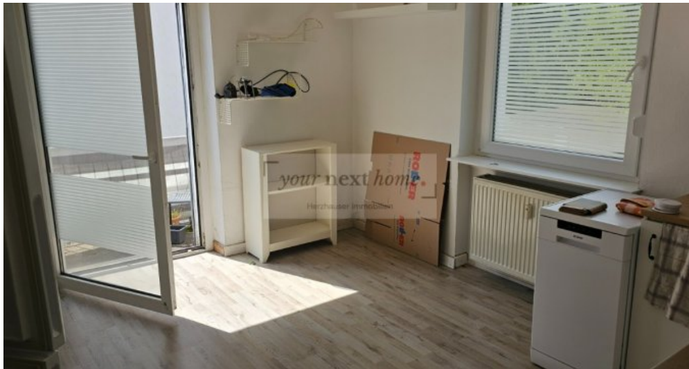
Küche mit Zugang zum Balkon