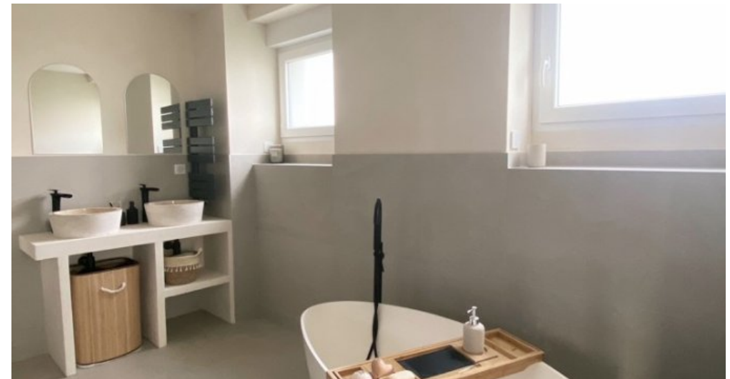
Bad im EG