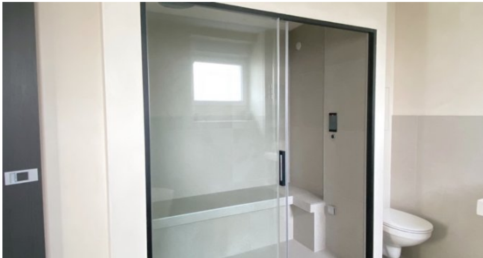
Dusche mit Dampfbad