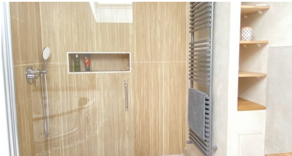
Begehbare Dusche OG