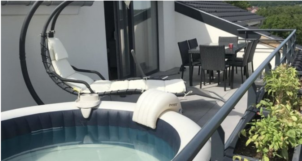
Terrasse im OG