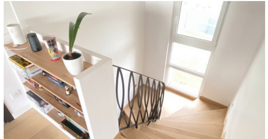
Treppenabgang zum EG