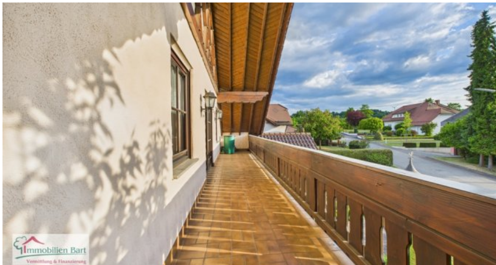
überdachter Balkon Westseite