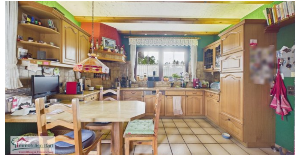
Küche EG mit Zugang zum Garten