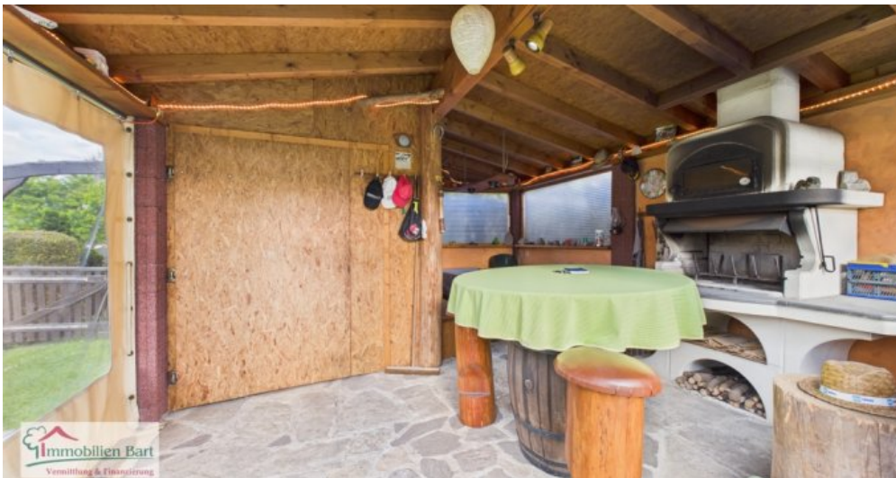
Gartenhaus mit Pizaofen