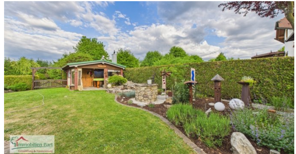
Gartenhaus, Zisterne, künstl. Bachlauf