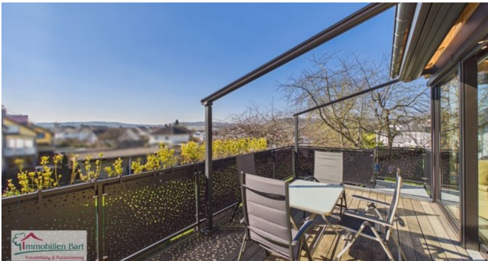
sonniger Balkon (nach Süd-Westen ausgerichtet)