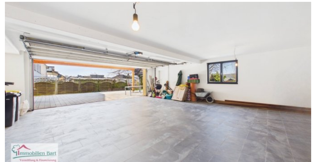
Doppelgarage im Untergeschoss