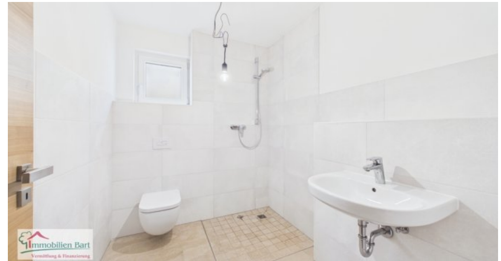
Duschbad im Kellerschoss