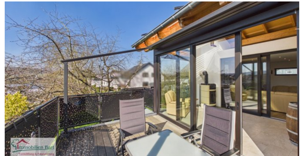
Balkon mit Zugang zum Wintergarten