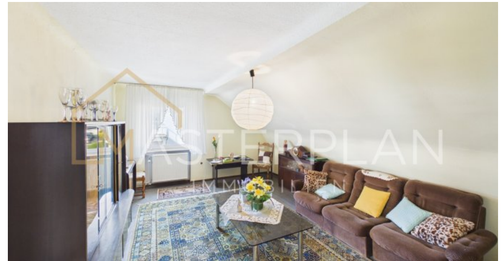
Schlafzimmer 2 OG