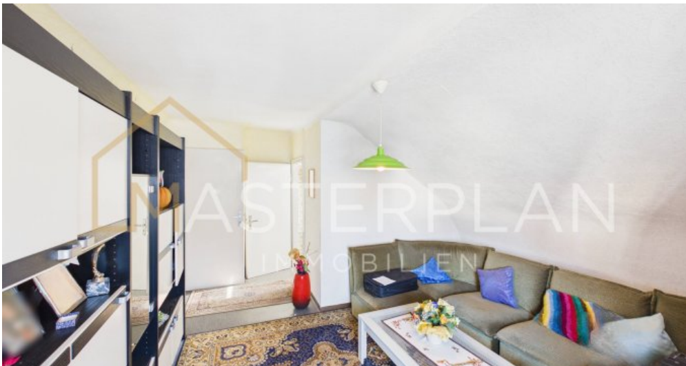
Schlafzimmer 3 OG