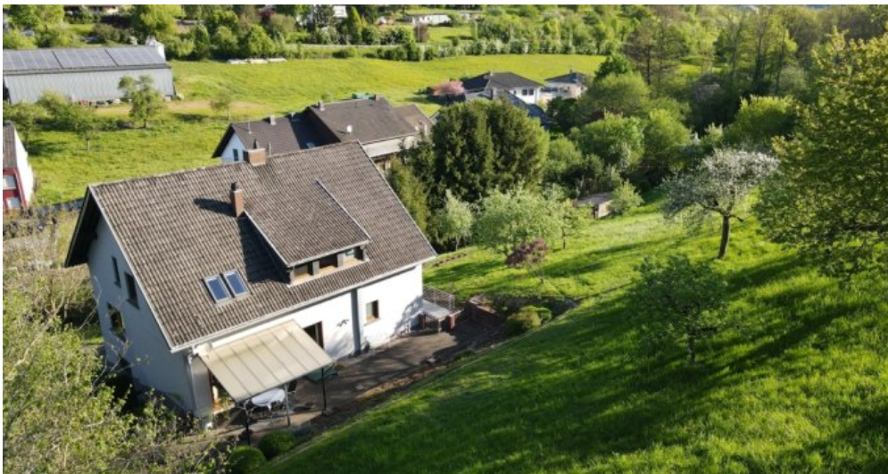
Rückansicht mit Grundstück