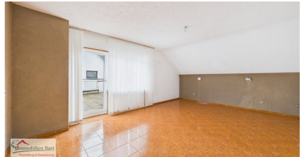
Schlafzimmer mit Ausgang zum Balkon OG