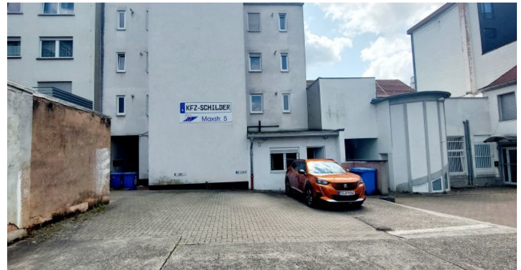
Ansicht hinter dem Gebäude