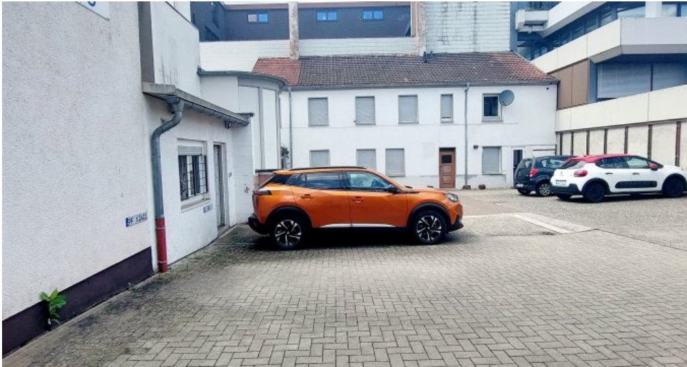
Ansicht hinter dem Gebäude