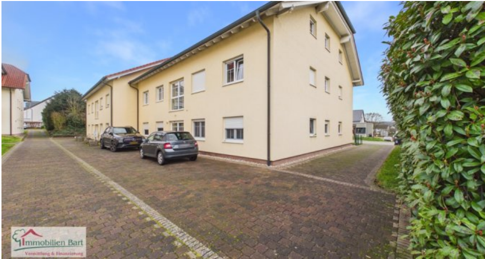
Ansicht Seite Eingang