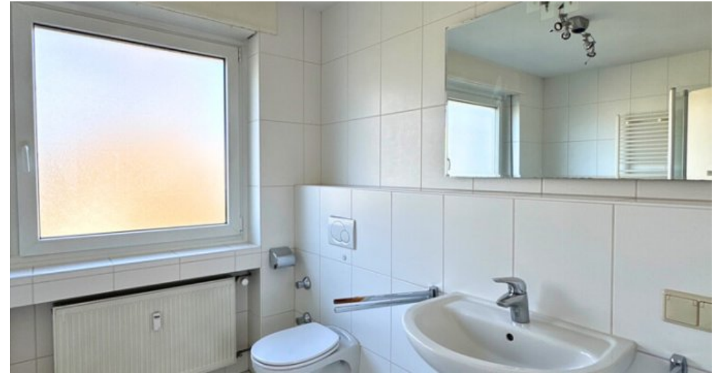
Bad mit Fenster OG