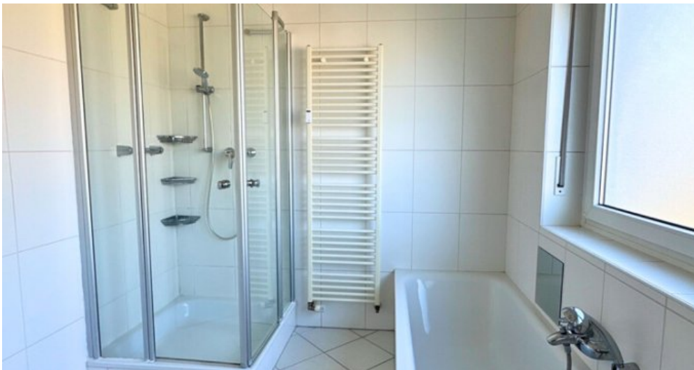
Bad mit Wanne und Dusche Og