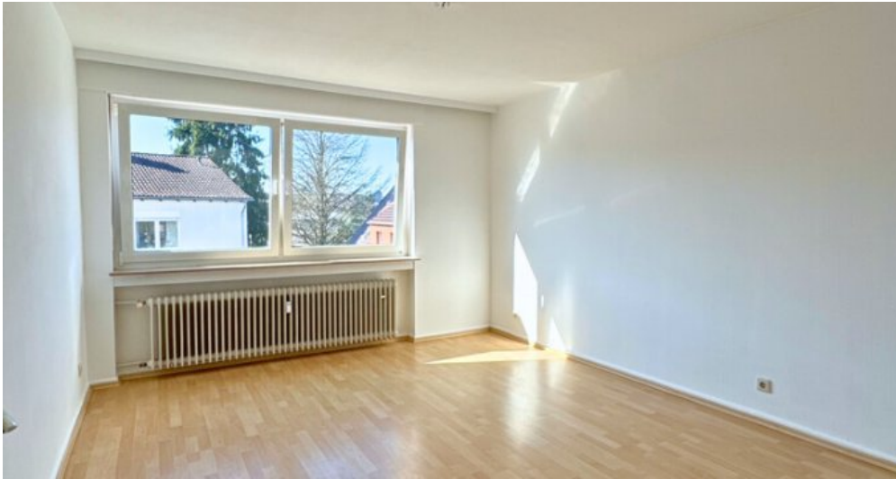
Schlafzimmer 2 OG