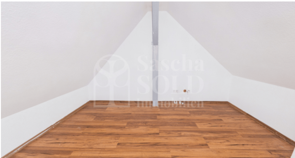
Zimmer im Dachspitz