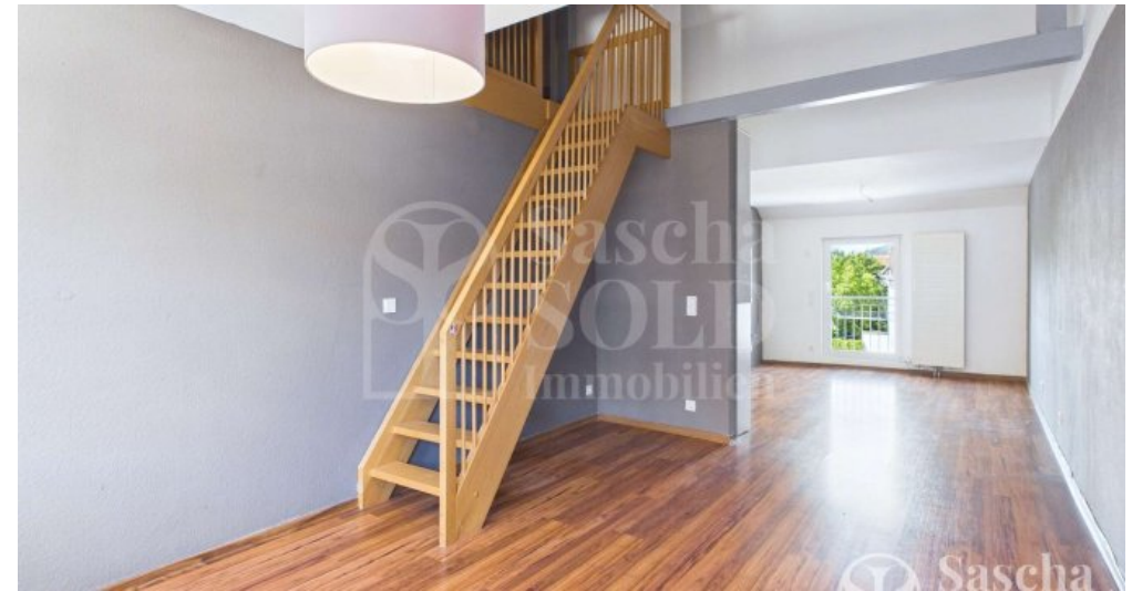
Wohnbereich mit Zugang zum Dachspitz