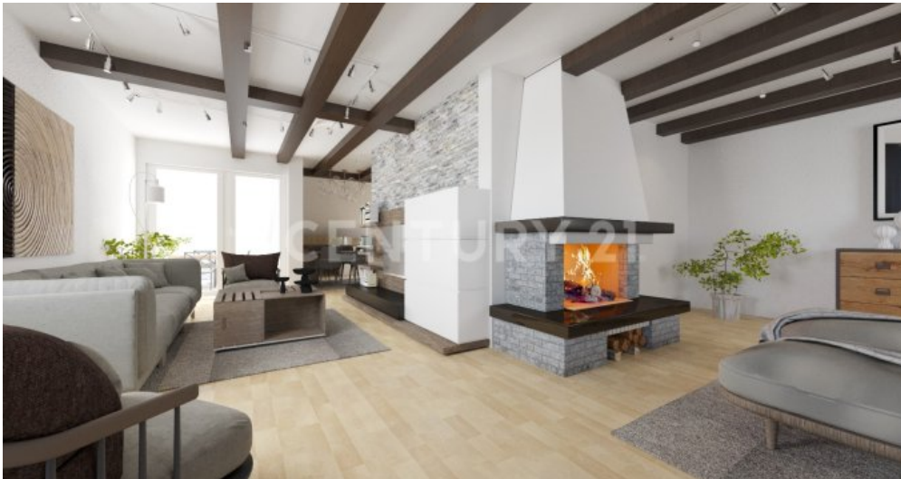
So könnte Ihr Wohnzimmer möbliert aussehen