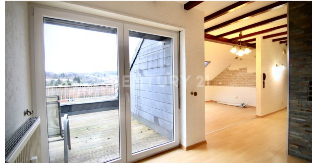
Zugang zum Balkon und Küche