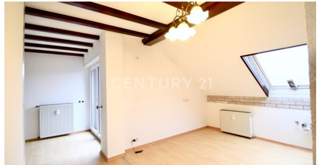
Gegenansicht der Küche