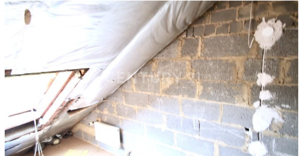
Dachboden möglicher Badezimmerbereich