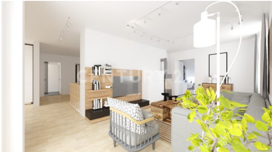
Visualisiert mit weißer Decke und zusätzlichen Zimmer