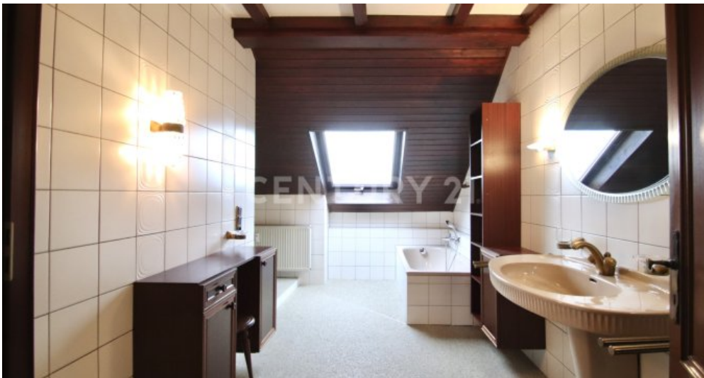
Badezimmer Sicht vom Ankleideraum