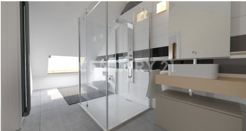
So lichtdurchflutet ,modern könnte man das Badezimmer bauen