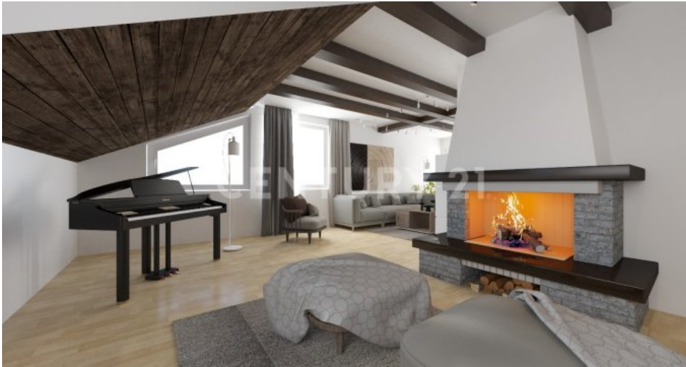
So könnte Ihr Wohnzimmer im Kaminbereich möglicherweise aussehen