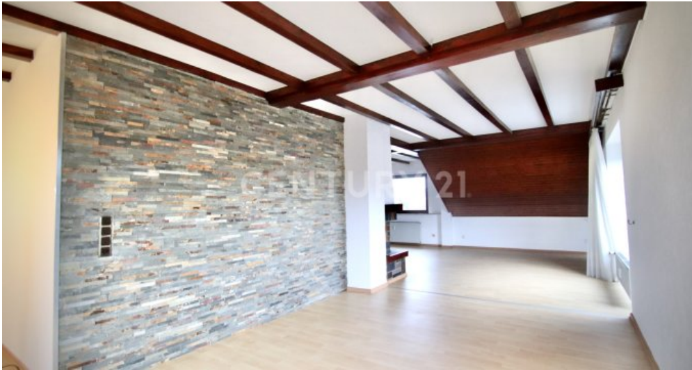
Esszimmerbereich mit Zugang zum Wohnzimmer