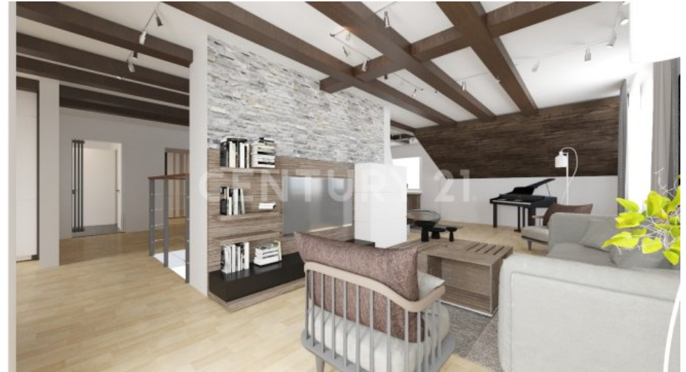
So könnte ihr Wohnzimmer möbliert aussehen von der Ansicht