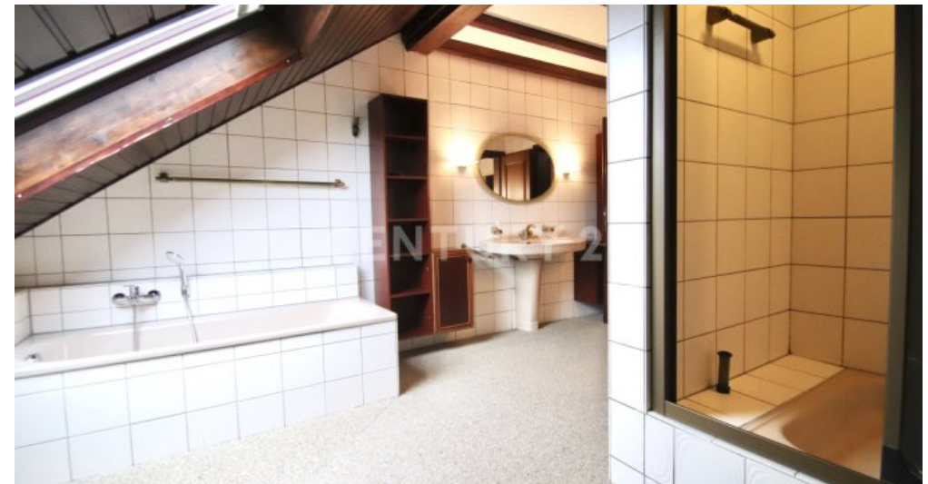
Badezimmer mit Wanne und Duschbereich