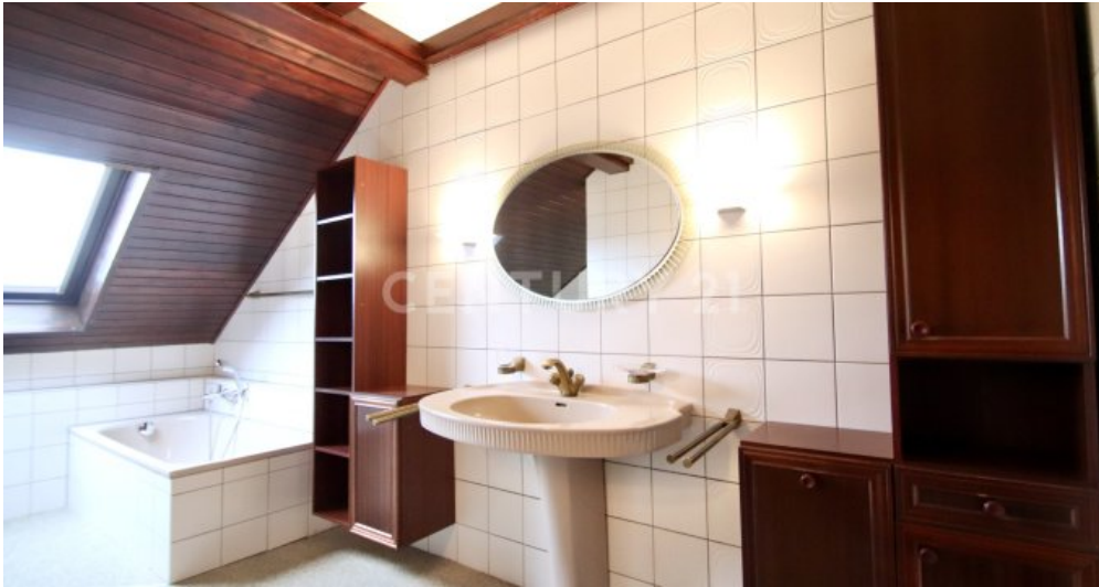
Badezimmer mit Waschplatz