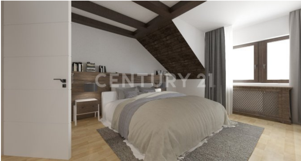
so könnte Ihr Eltern -Schlafzimmer möbliert aussehen