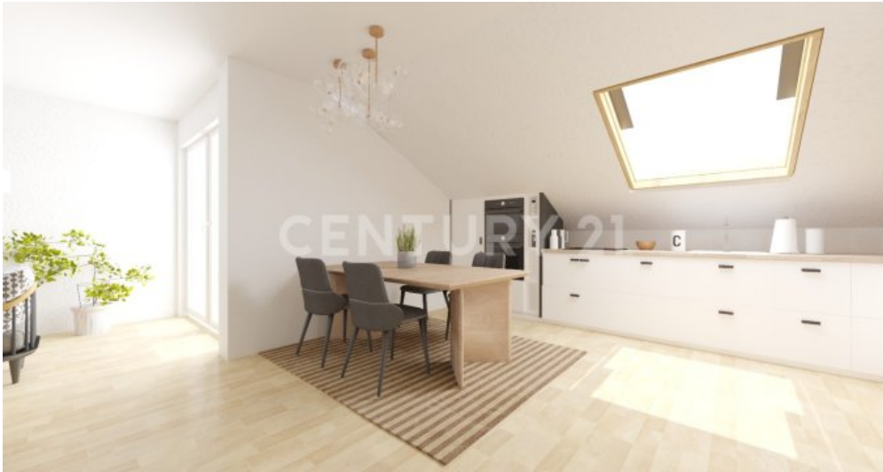
Beispiel der modernen Einrichtung Ihrer Küche