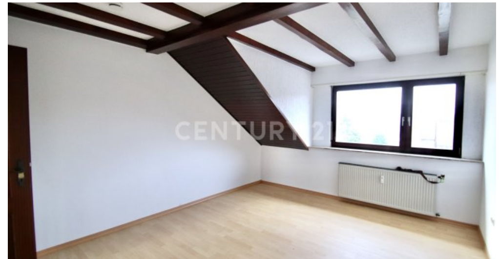
Großes Eltern- Schlafzimmer