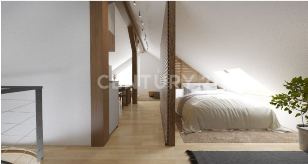
Einrichtungsbeispiel des Dachbodens ( Traumhaft )