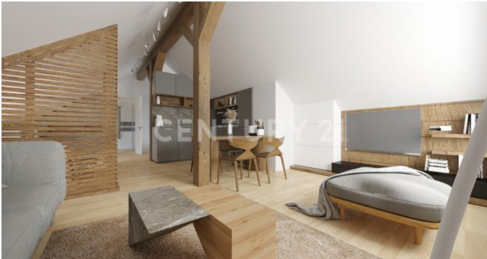
So könnte der Dachboden modernisiert aussehen