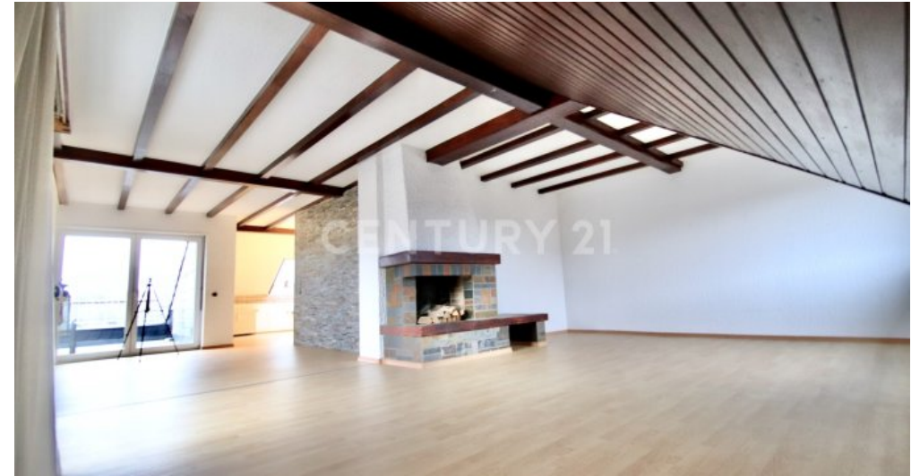
Großes offenes, lichtdurchflutetes Wohnzimmer