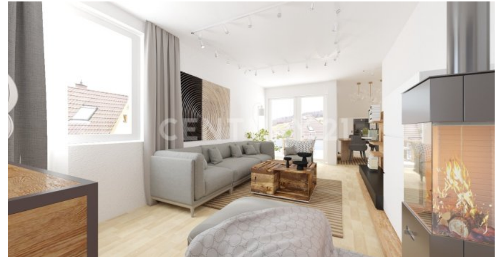
Visualisierung Wohnzimmer mit weissen Decken