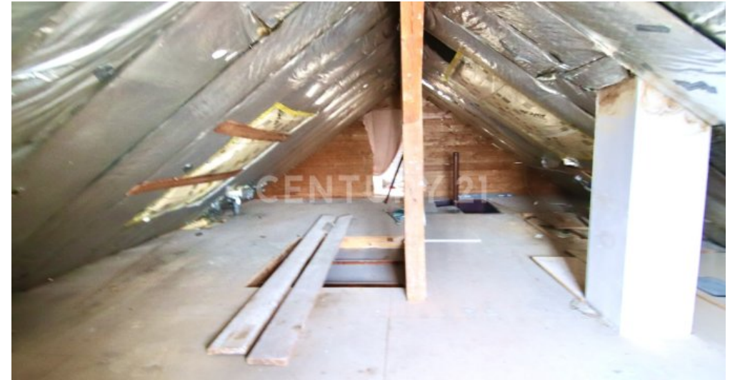
Aktuelle Ansicht des Dachboden mit Ausbaumöglichkeit