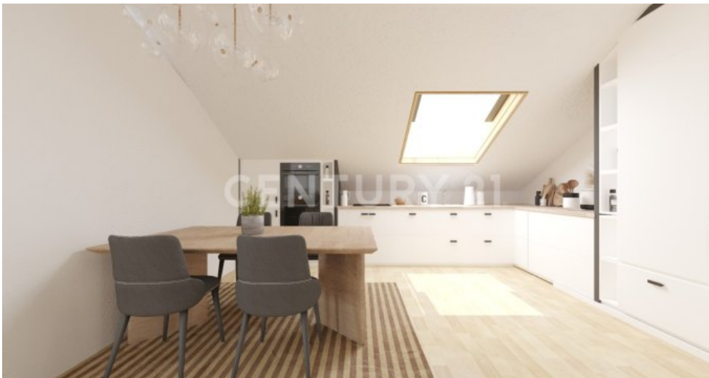
So könnte Ihre Küche eingerichtet aussehen (Visualisierung)