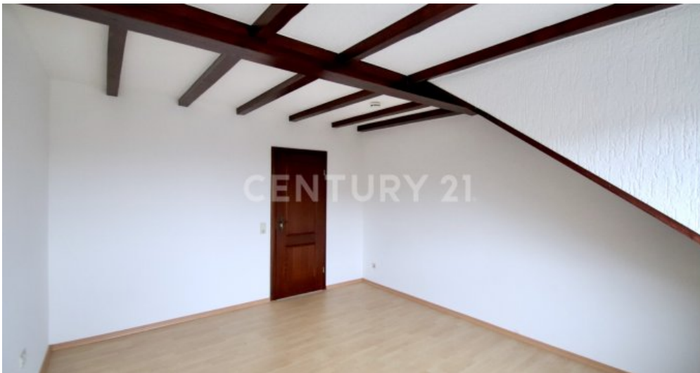
Eltern- Schlafzimmer Gegenseite