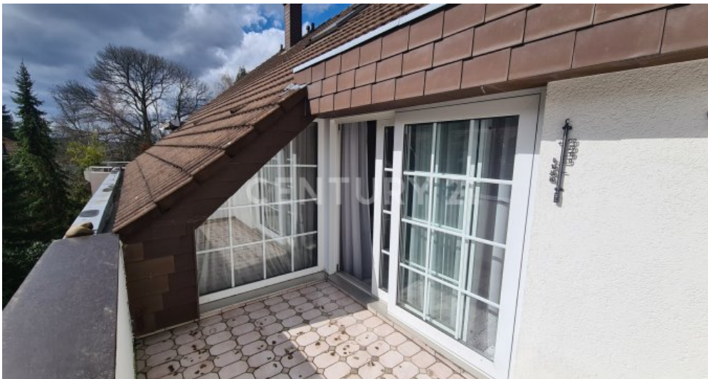
Balkon am Schlafzimmer