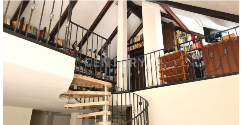
Aufgang zum oberen Bereich