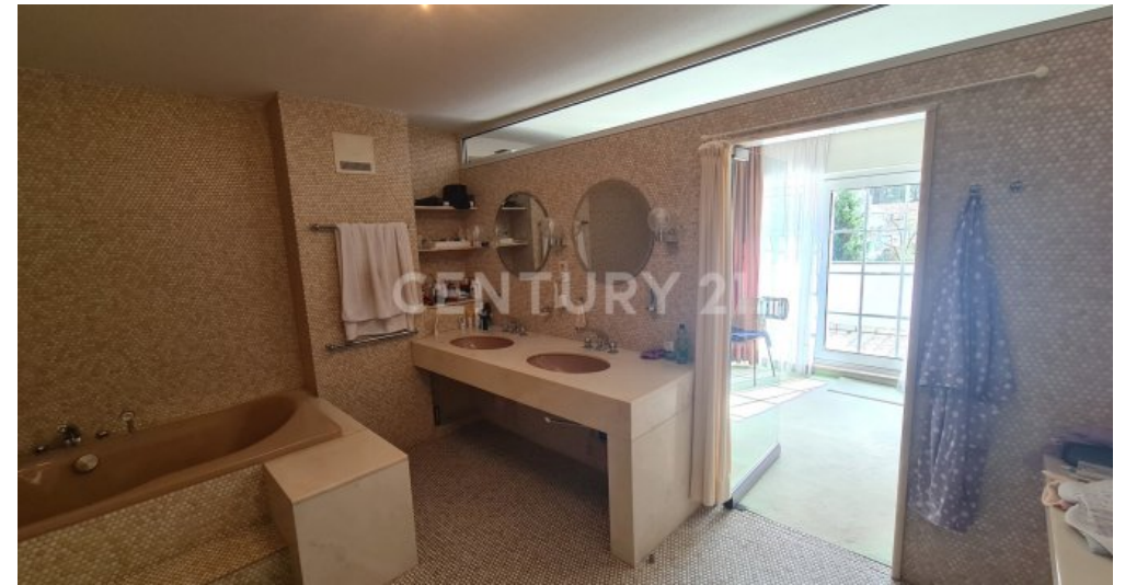
Badezimmer mit Zugang zum Schlafzimmer