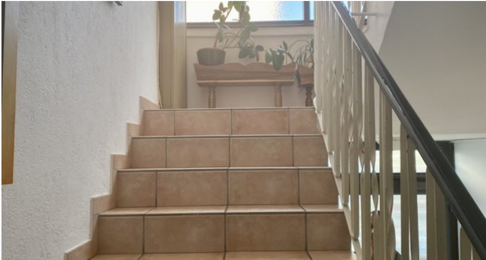
Treppen zum Obergeschoss