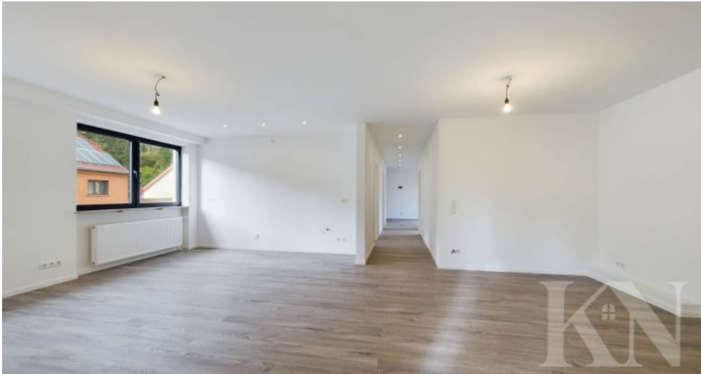
Wohn - und Essbereich