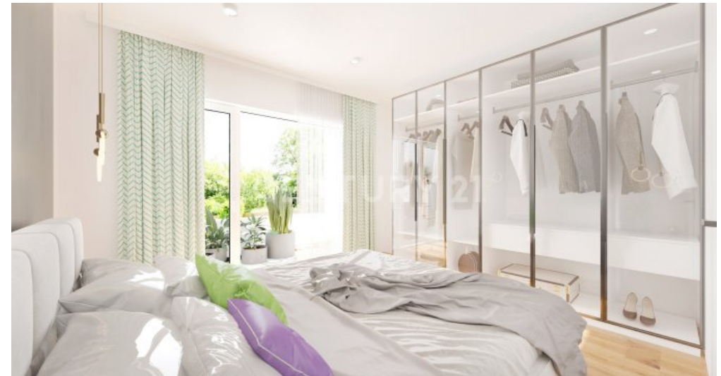
...mit Balkon visualisiert