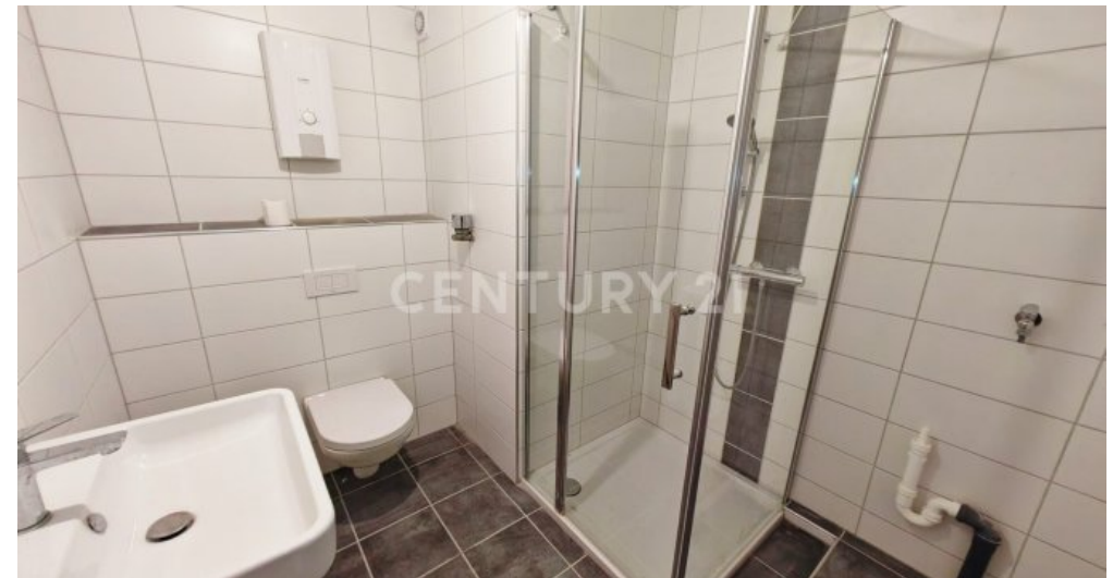
Badezimmer mit ebenerdiger Dusche