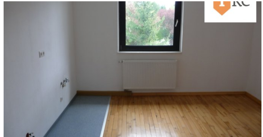
Esszimmer mit Küche