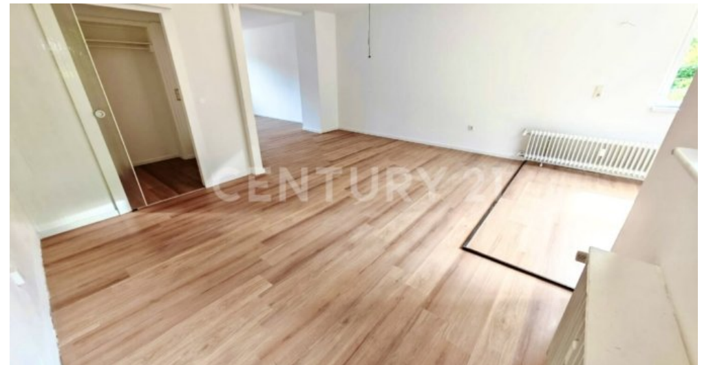
Küche und Essbereich