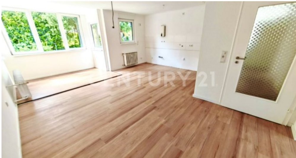
Helle Küche + Essbereich