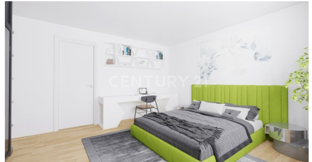
OG Schlafzimmer Visualisiert