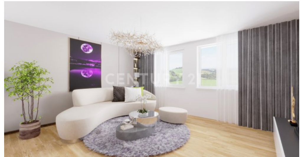
OG Küche Essen Wohnen Visualisiert