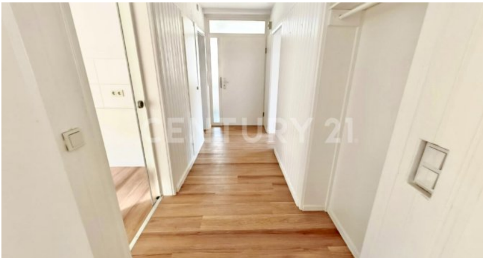
Flur (Eingangsbereich der Wohnung)