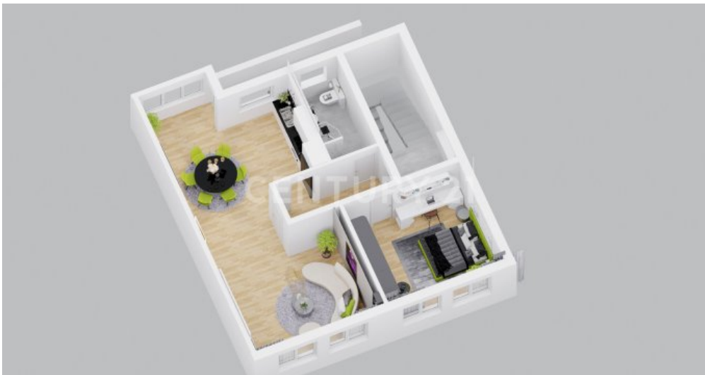
OG 3D Grundriss Visualisiert