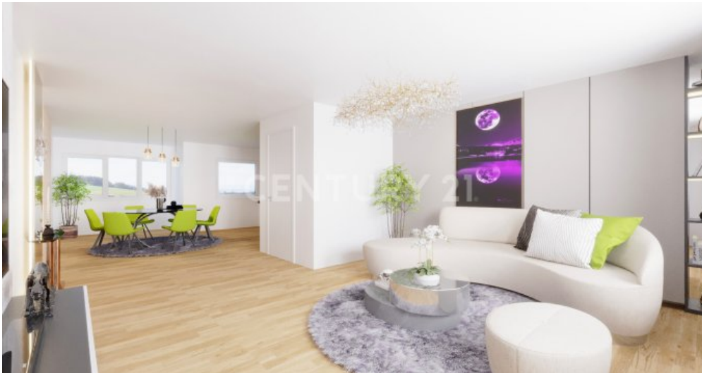
OG Ku?che Essen Wohnen Visualisiert