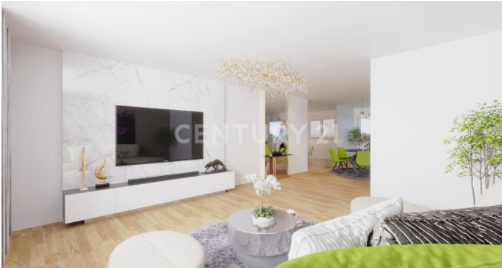
OG Ku?che Essen Wohnen Visualisiert