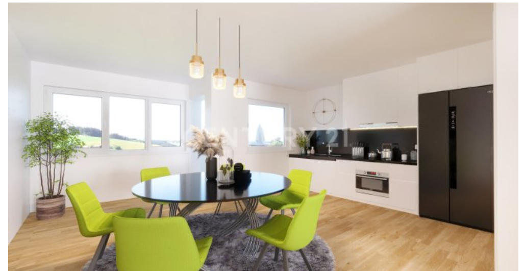
OG Ku?che Essen Wohnen Visualisiert