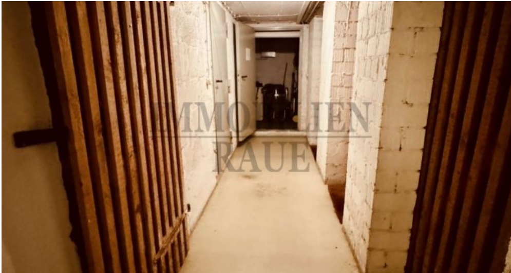
Flur im Keller