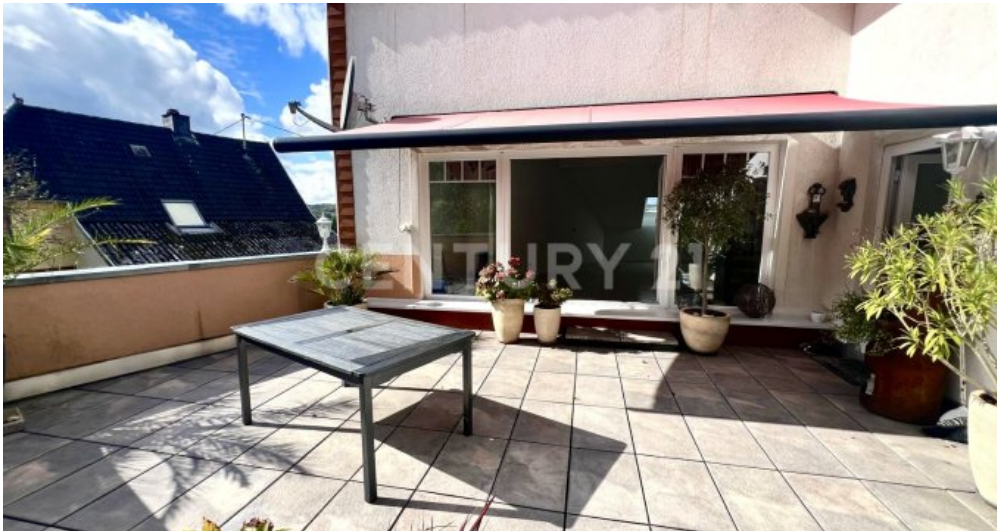
Terrasse mit Markise