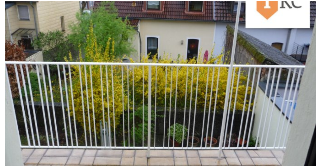
Balkon mit Blick in den Garten