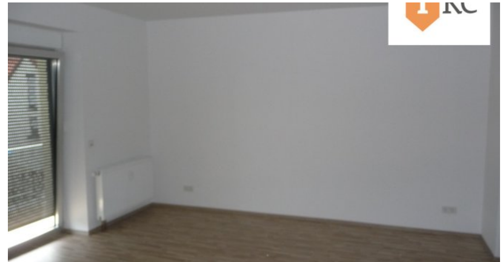
2. Zimmer mit Zugang zum Balkon Archivfoto