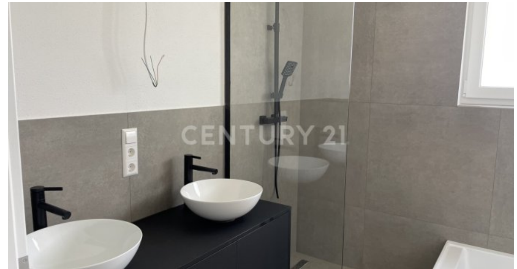
Waschbecken & Dusche