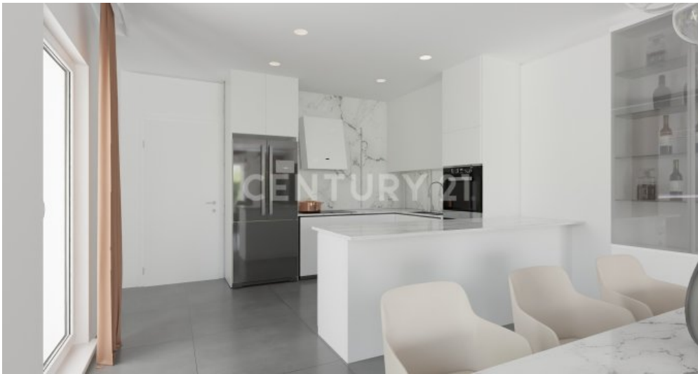
Küche Essen Wohnen Visualisiert