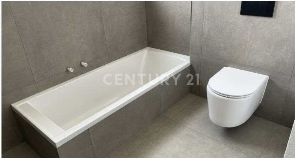
Bad mit Wanne & WC