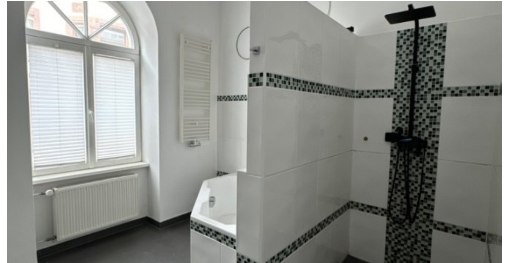
Bad mit Dusche und Fenster