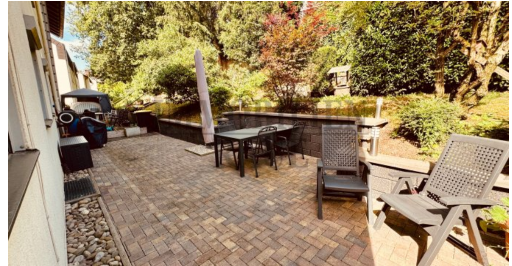
Gemeinsame Terrasse hinter dem Haus