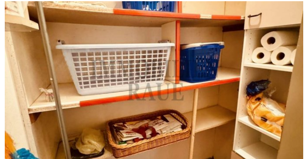
Abstellraum i.d. Whg.