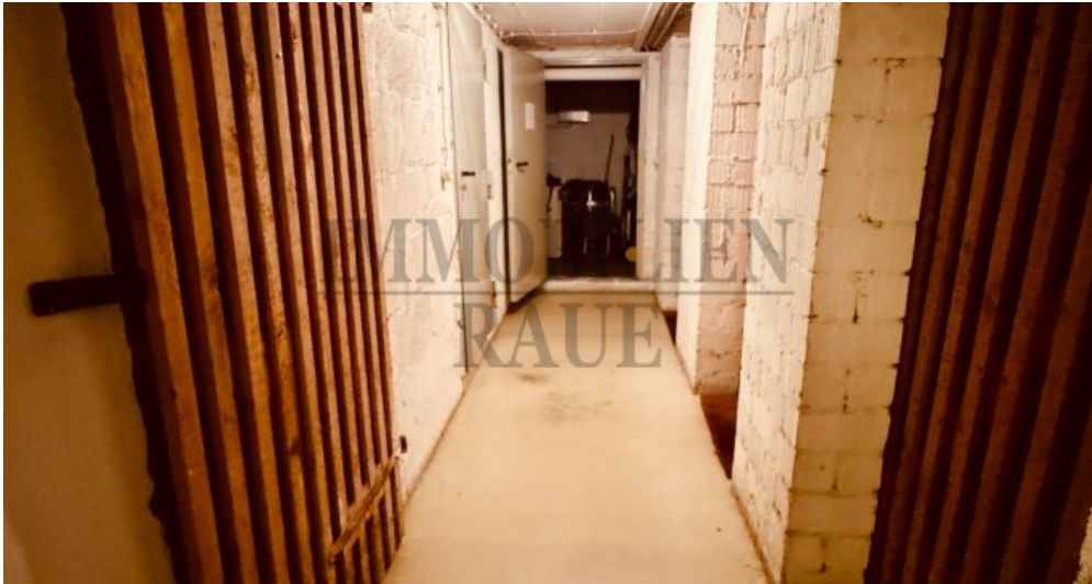
Flur im Keller