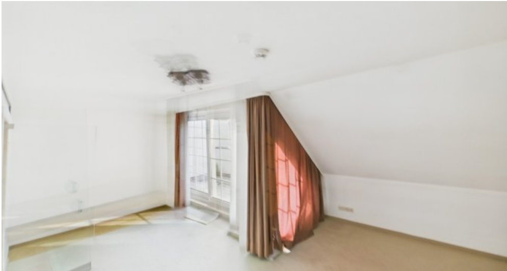
Schlafzimmer mit Balkon klein