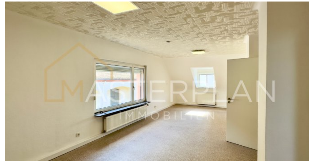
Wohn - und Esszimmer