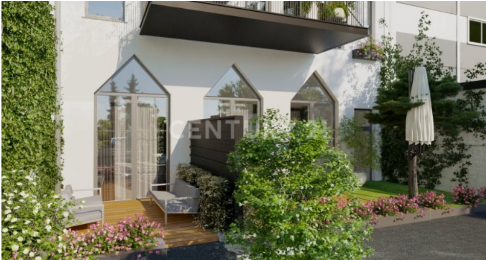
Aussen Vis. Update (5)