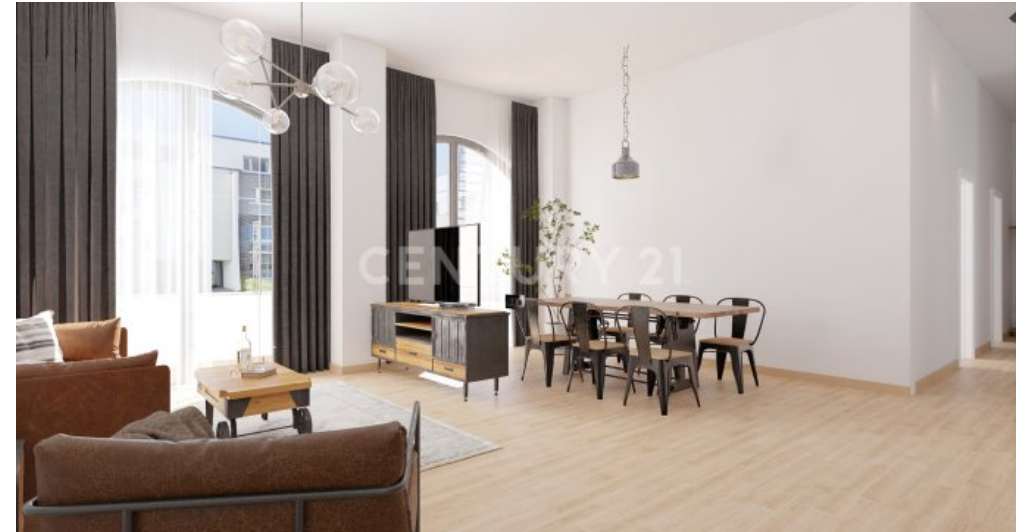
Wohnung 0.3 Update (2)