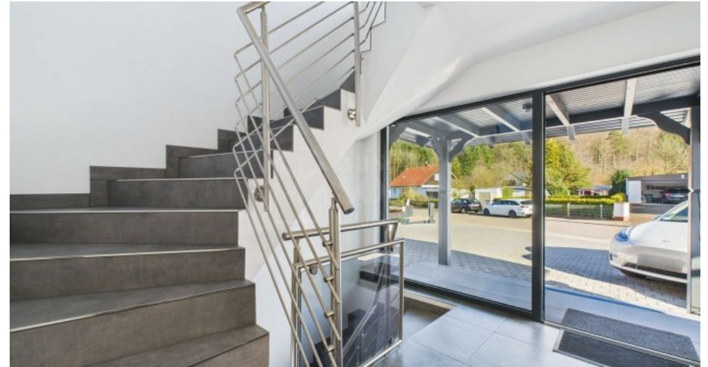
EG - Treppe zum DG