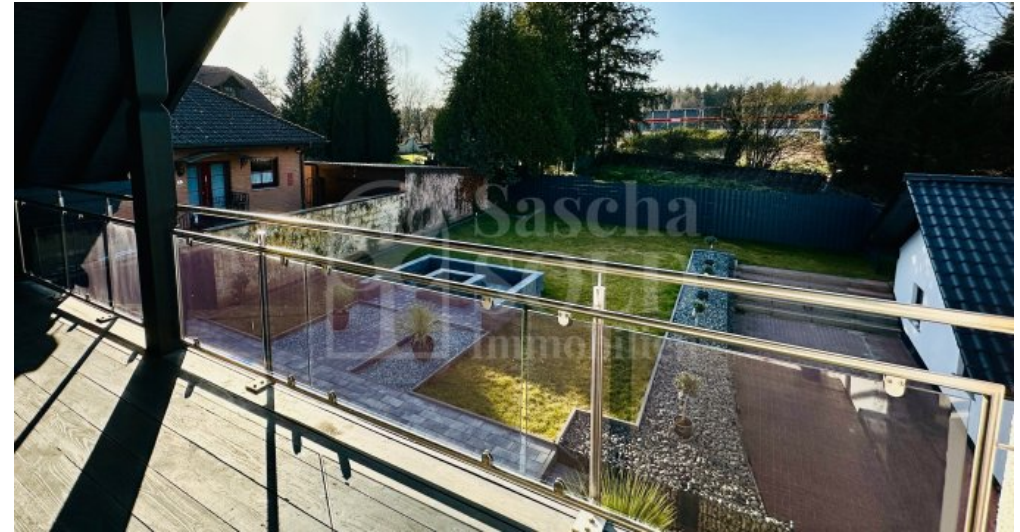
WE im DG - Loggia