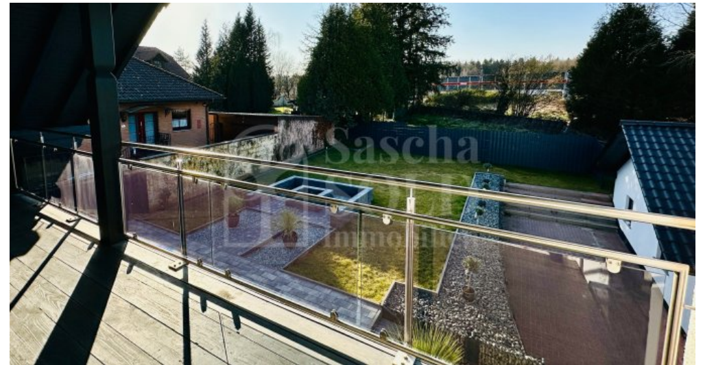
WE im DG - Loggia