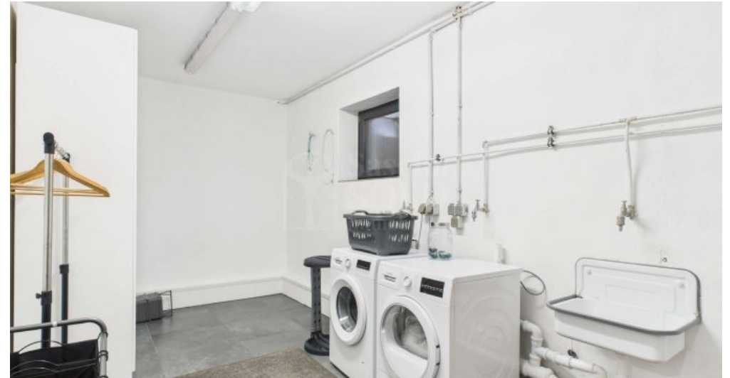
UG - Waschküche