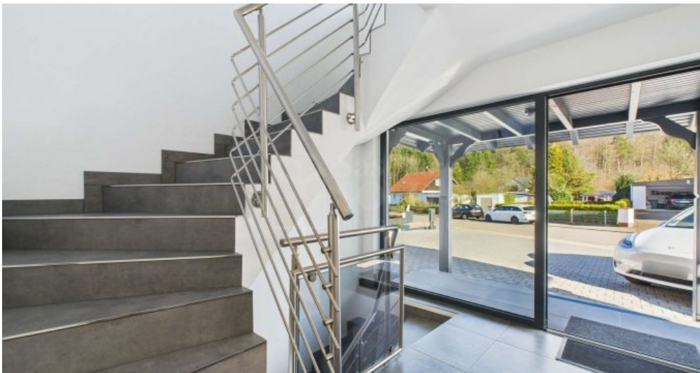
EG - Treppe zum DG