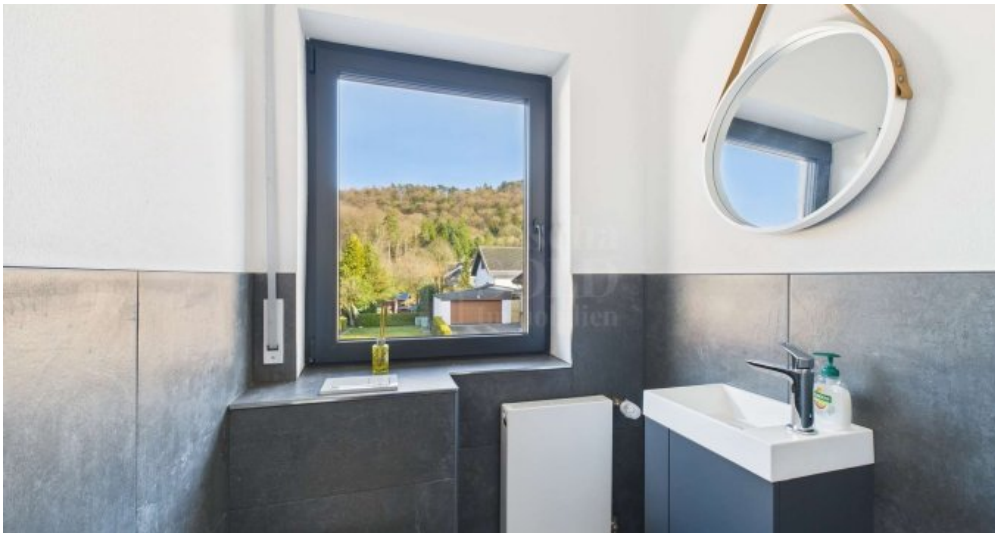
WE im DG - Gäste-WC